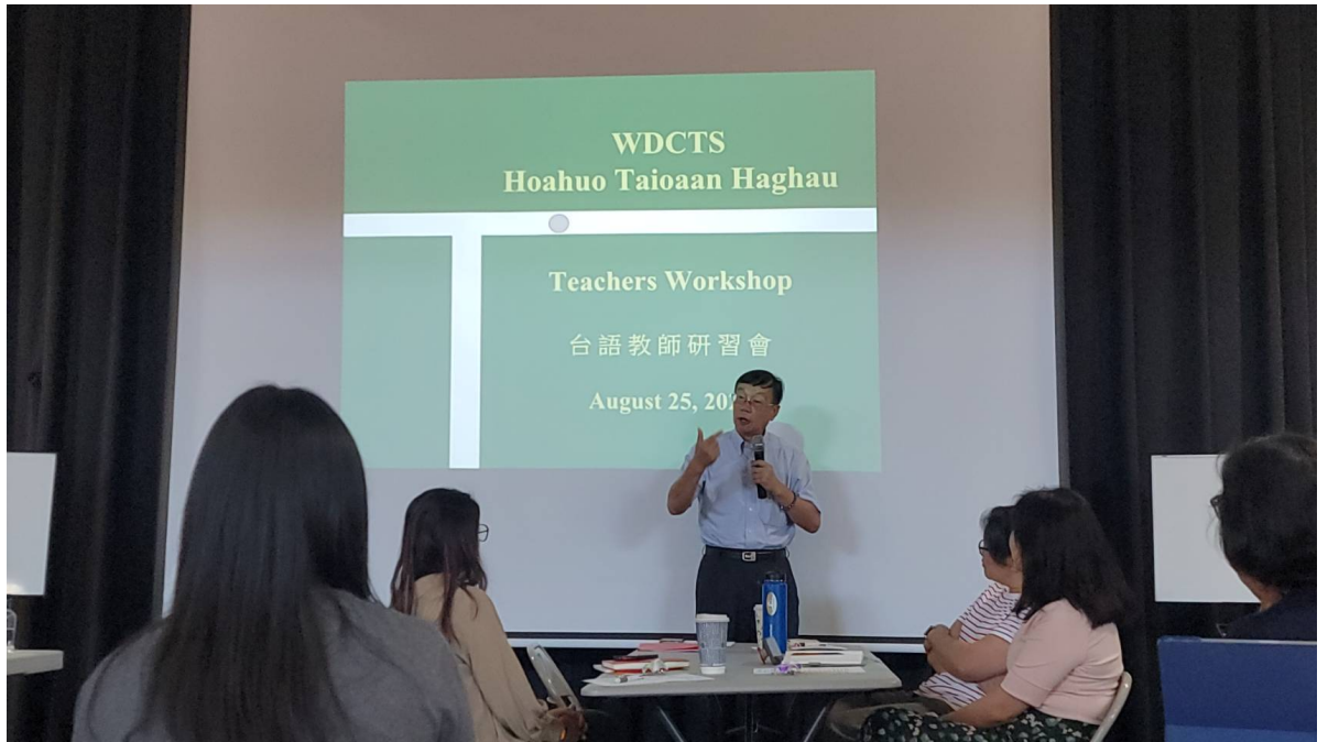
華府台灣學校舉辦2024台語教師研習會5