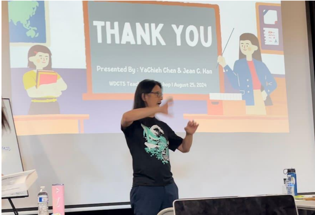
華府台灣學校舉辦2024台語教師研習會6