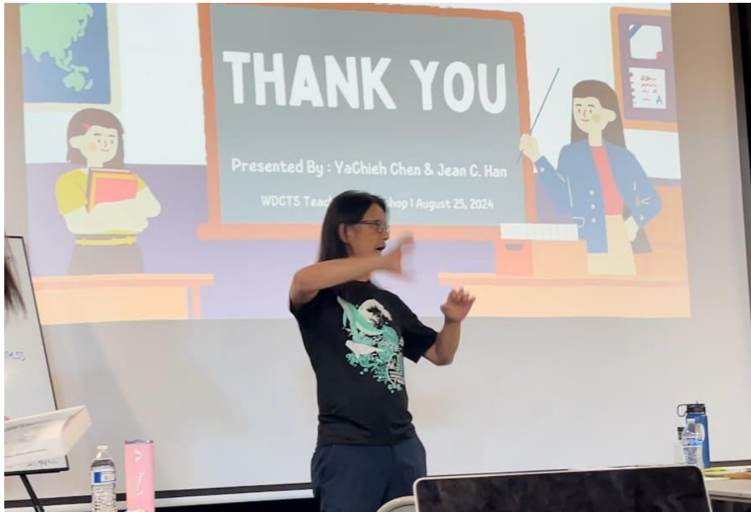
華府台灣學校舉辦2024台語教師研習會6