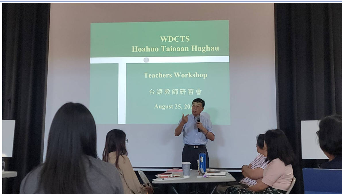
華府台灣學校舉辦2024台語教師研習會5