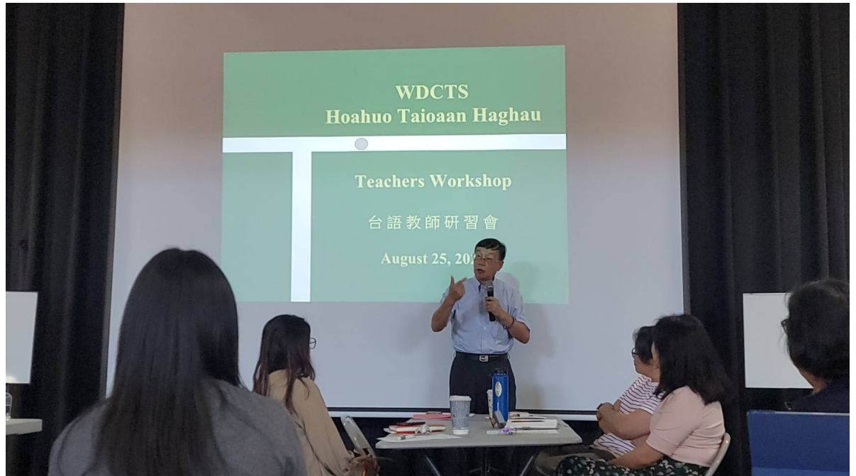
華府台灣學校舉辦2024台語教師研習會5