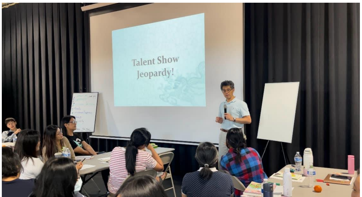
華府台灣學校舉辦2024台語教師研習會1

此外，活動中還邀請了三位經驗豐富的教師，分別代表小學、國中和高中進行分享與指導。他們透過分組討論和模擬課程，針對各個年齡層學生在台語學習中可能遇到的挑戰提出了具體的解決方案：包括提供有趣的字卡，以文字競賽的搶答方式，教學使用的遊戲等方式，給在場老師們非常實用明的課堂操作技巧。這些分組討論不僅促進了教師之間的經驗交流，也為未來的台語課程設計提供了實用的建議和方向。參與的教師們皆表示此次培訓受益良多，為日後的台語文教學奠定了更堅實的基礎。