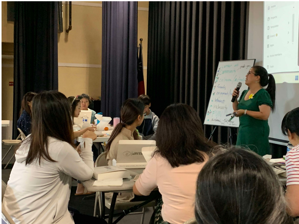
華府台灣學校舉辦2024台語教師研習會2