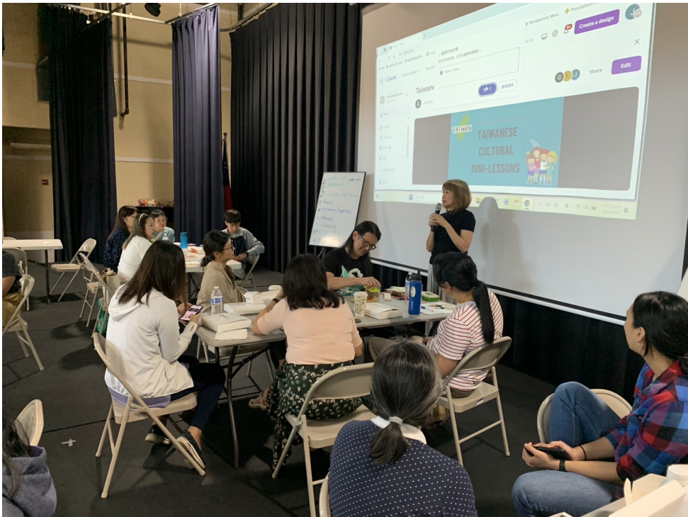
華府台灣學校舉辦2024台語教師研習會3