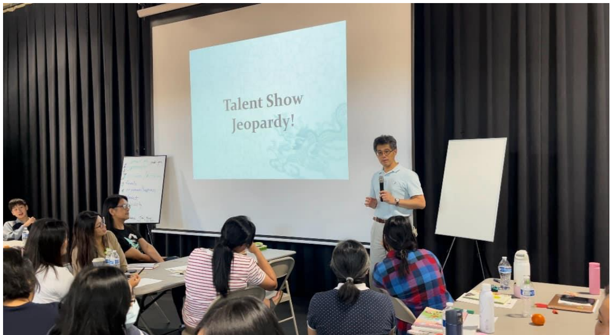
華府台灣學校舉辦2024台語教師研習會1

此外，活動中還邀請了三位經驗豐富的教師，分別代表小學、國中和高中進行分享與指導。他們透過分組討論和模擬課程，針對各個年齡層學生在台語學習中可能遇到的挑戰提出了具體的解決方案：包括提供有趣的字卡，以文字競賽的搶答方式，教學使用的遊戲等方式，給在場老師們非常實用的課堂操作技巧。這些分組討論不僅促進了教師之間的經驗交流，也為未來的台語課程設計提供了實用的建議和方向。參與的教師們皆表示此次培訓受益良多，為日後的台語文教學奠定了更堅實的基礎。