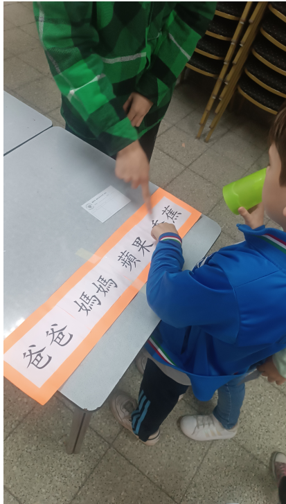
2024新興文教中文學校國際部趣味漢字比拚比賽4