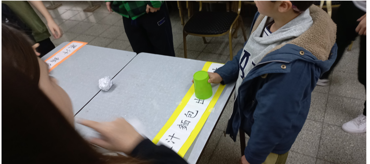
2024新興文教中文學校國際部趣味漢字比拚比賽1

新興文教中文學校於本學期第三週（八月十七日）早上，舉行了國際部趣味漢字比拚比賽，宗旨在於能由此活動將學生對漢字的結構，藉著遊戲和競賽的方式，達到認字及其文字本身的意義，並激發學生對學習中文字的興趣和了解。參加對象為國際部低中高年級生，9:40至10:20是五六年級生，10:30至11:10是三四年級生，11:20至12:00是一二年級生。比賽方式是分成三關，一組由三個人同時參加，各發一枚棋子，每個學生依順序投骰子，並根據骰子的數字在大富翁的地圖上移動自己的棋子（前進），學生必須得用中文唸出移動的步數，否則扣分，最先到達終點的可以過關，每輪對抗取二名贏家。第二關是認字加反應速度，由兩位學生分發一張遊戲卡和一個杯子，遊戲卡裡有四個詞語，當主持者念詞語時學生須迅速將杯子蓋住那詞語，成功者可得一球，以球數來計分。第三關是將文字的部首正確選出，每字以十秒為限，以此類推來計分。當比賽的學生完成了三關的考驗，再將分數加以統計，即能分組列出得獎者。這種活動通常是學生所喜愛的，老師也樂此不疲地設計圖卡和字卡，為了能藉著不斷翻新的文字遊戲，讓學生深深愛上漢字，無論在聽說讀寫上都能相得益彰。