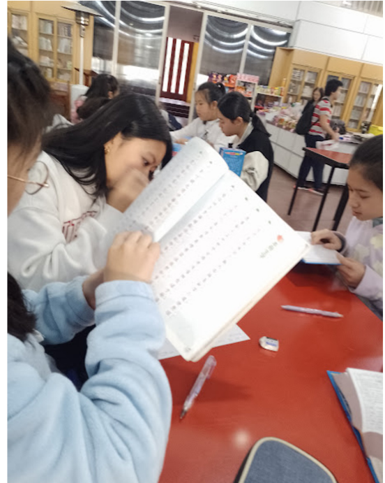
2024學年度愛育學校 「正體漢字文化節國語文國小高年級組語詞接龍比賽」5