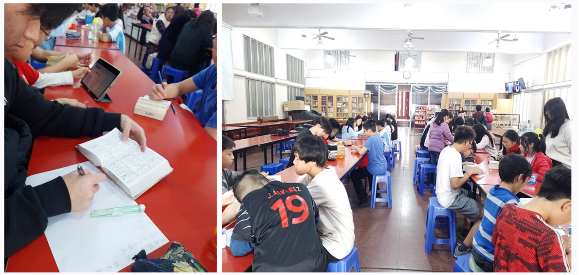
2024學年度愛育學校「正體漢字文化節國語文國小高年級組語詞接龍比賽」6