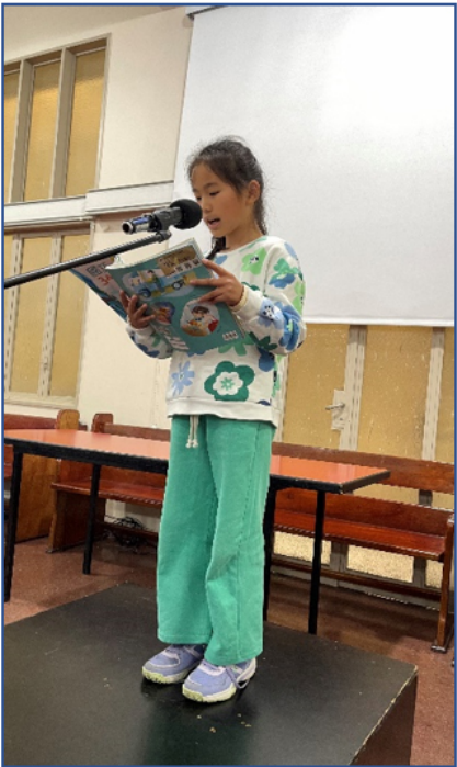
2024學年度愛育學校 正體漢字文化節「朗讀決賽」3