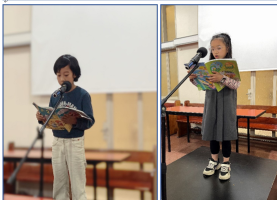
2024學年度愛育學校 正體漢字文化節「朗讀決賽」2