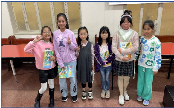
2024學年度愛育學校 正體漢字文化節「朗讀決賽」3