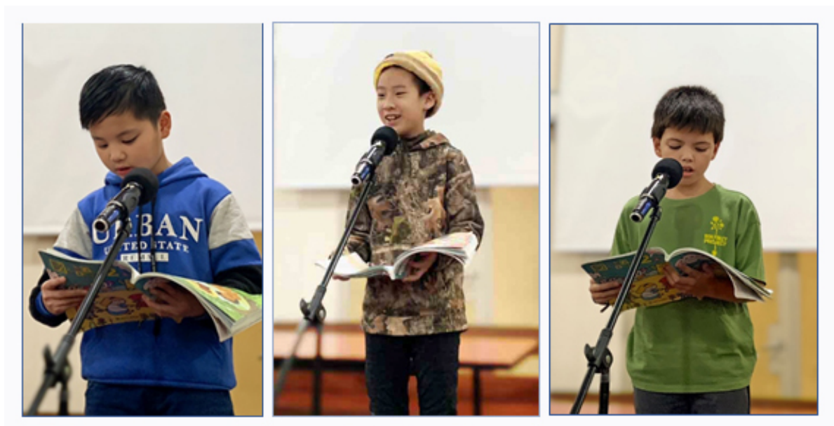
2024學年度愛育學校 正體漢字文化節「朗讀決賽」1