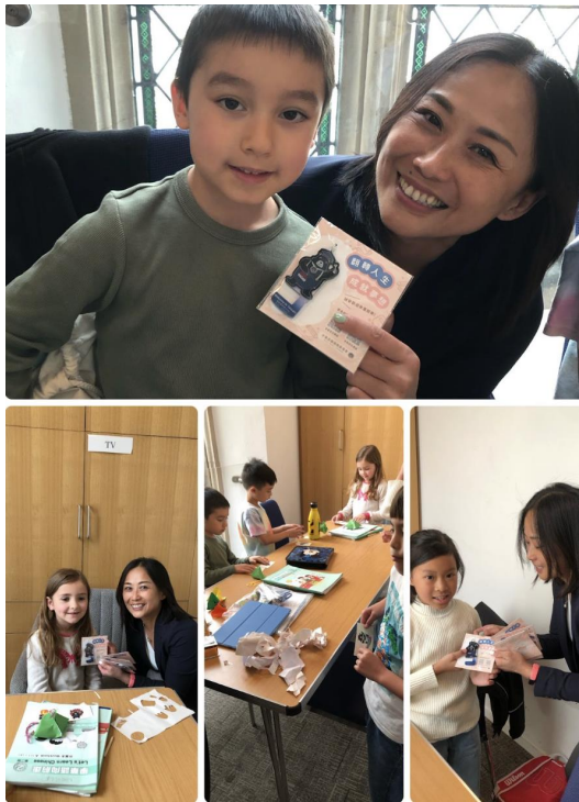
大家一起辦理I僑卡，開心地收到僑委會贈送的禮物