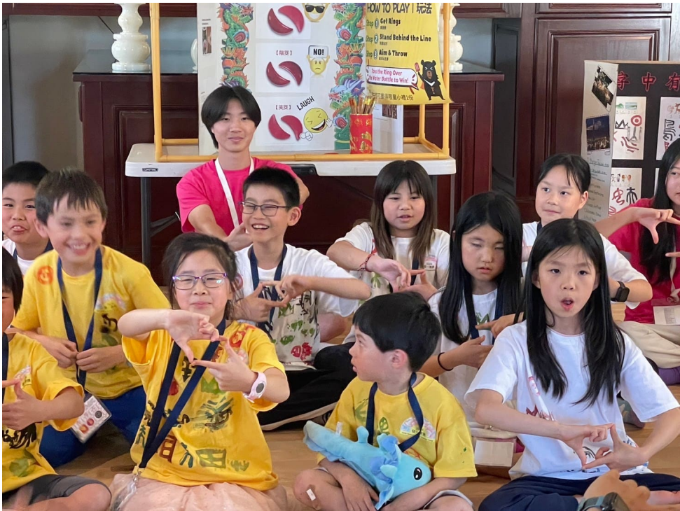
學員成果展-律動和隊呼表演