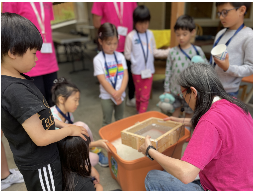
造紙文化-做一張獨一無二的手工紙