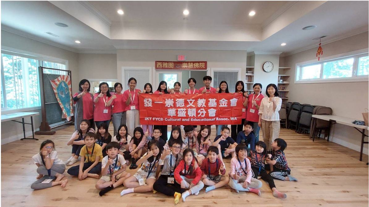
學員、輔導員和老師大合照