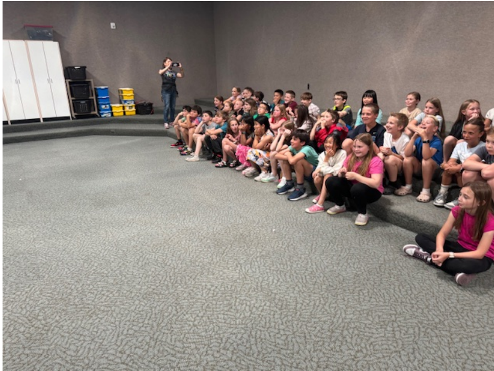
臺美兩地小學生線上交流