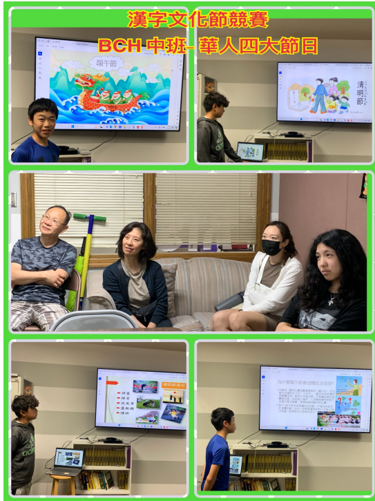
Q2- 中班 1