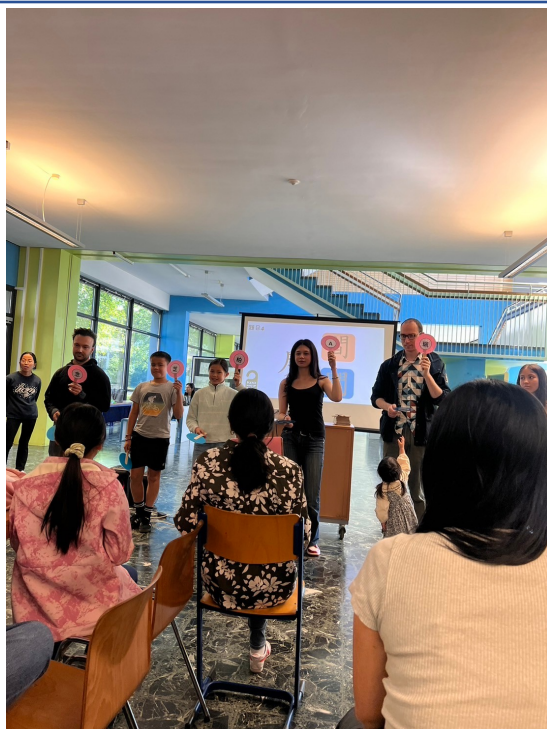
2024年福爾摩沙中文學校端午正體漢字競賽3