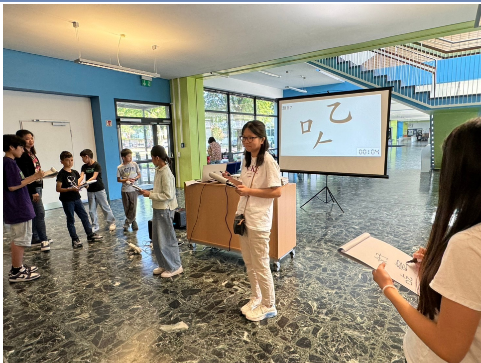
2024年福爾摩沙中文學校端午正體漢字競賽4