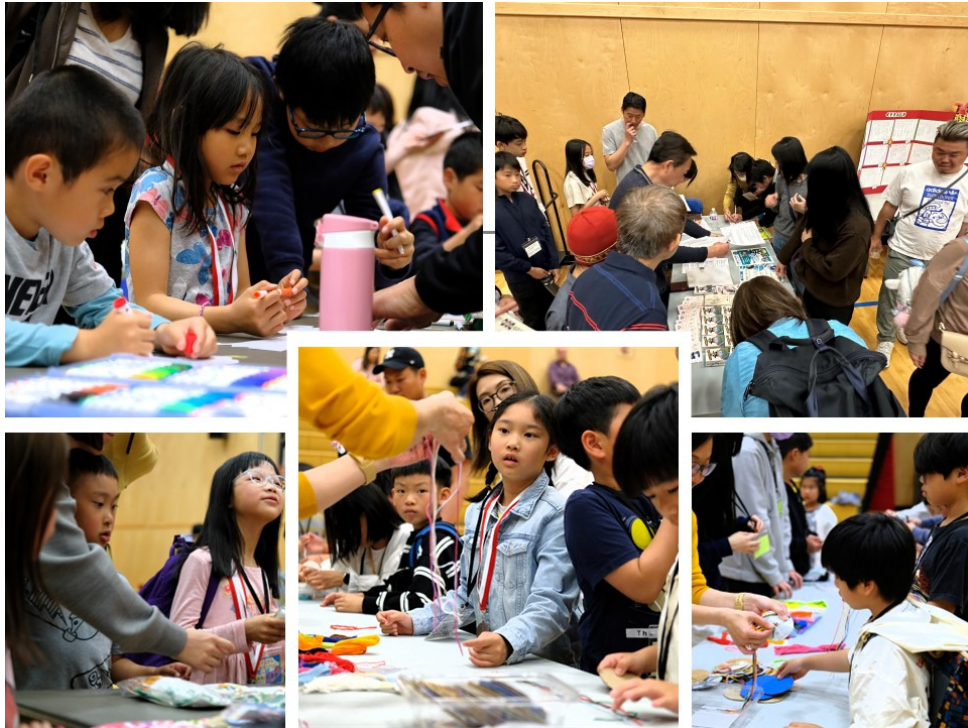
各項活動深受學生和家長喜愛