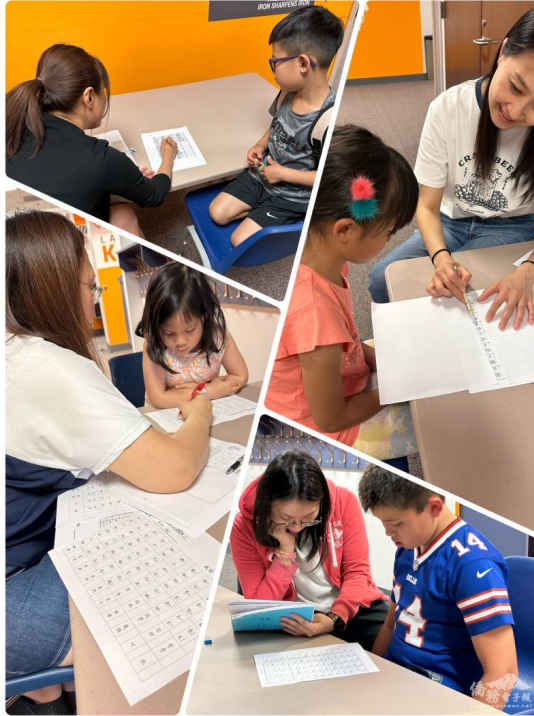
學生們進行認字檢定