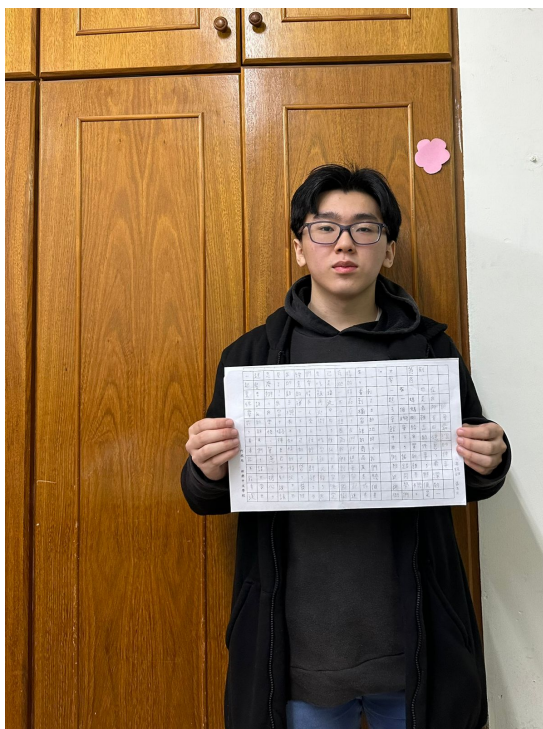
113年正體漢字文化節系列活動 阿根廷新興中文學校全校作文比賽2