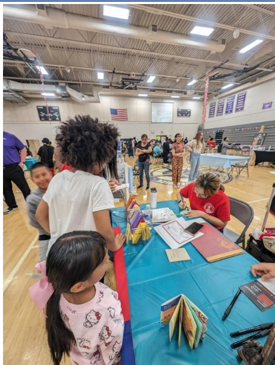
製作精緻的客製化書籤給參與學生留作紀念