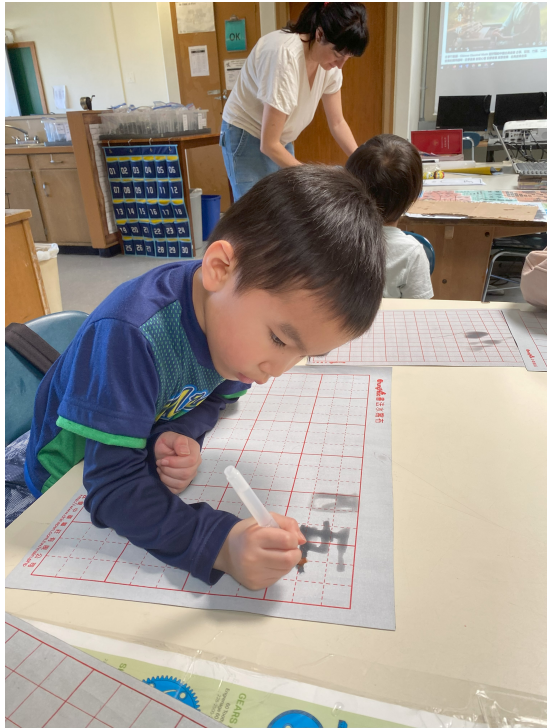
一年級練習使用毛筆