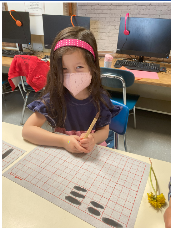
幼兒班練習用毛筆寫數字