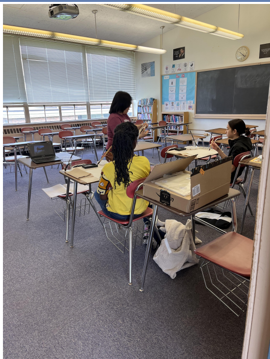
老師指導毛筆用法