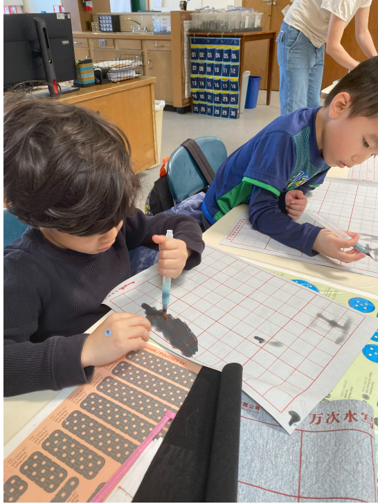
一年級練習用毛筆寫數字