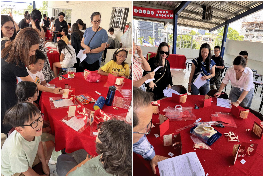
多明尼加臺灣商會附屬中文學校2024母親節活動 - Feliz día de la Mamá 感恩母親3