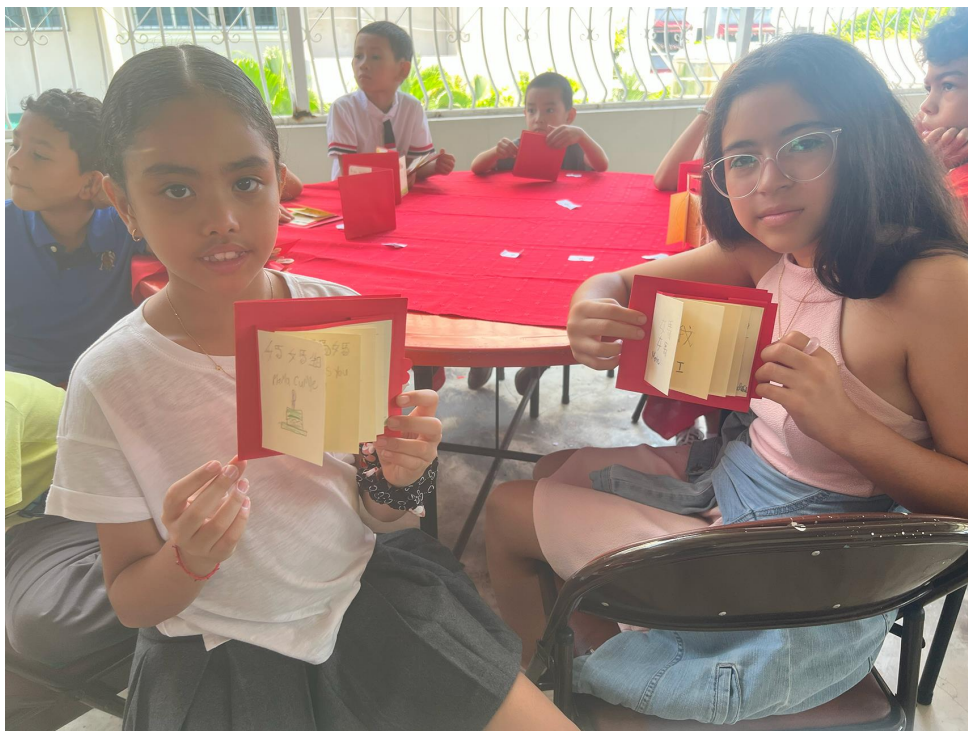
多明尼加臺灣商會附屬中文學校2024母親節活動 - Feliz día de la Mamá 感恩母親1

我們邀請當天參加活動的媽媽們一起來當這次母親節卡片的評審委員，除了老師們針對文字內容的評審，媽媽們則是從各班的作品中選出五張他們最喜歡的卡片。多明尼加的母親節和我們不同，是每年五月的最後一個星期，雖然還沒到，我們也讓學生獻唱本地的母親節歌曲Himno a la Madre預祝多明尼加的媽媽們母親節快樂。