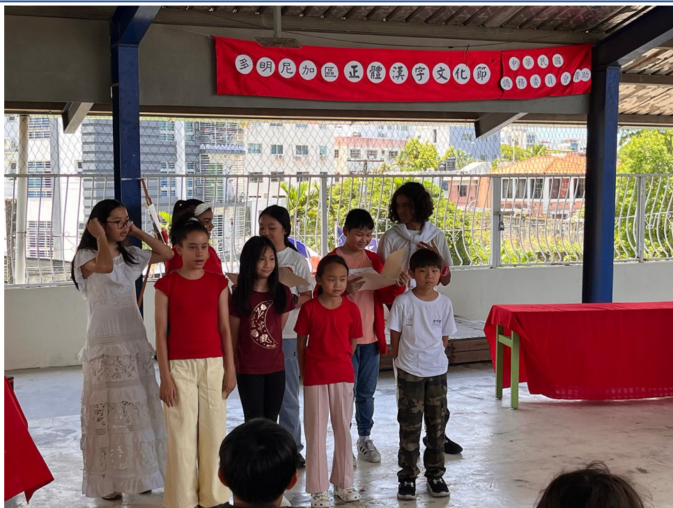
多明尼加臺灣商會附屬中文學校2024母親節活動 - Feliz día de la Mamá 感恩母親2