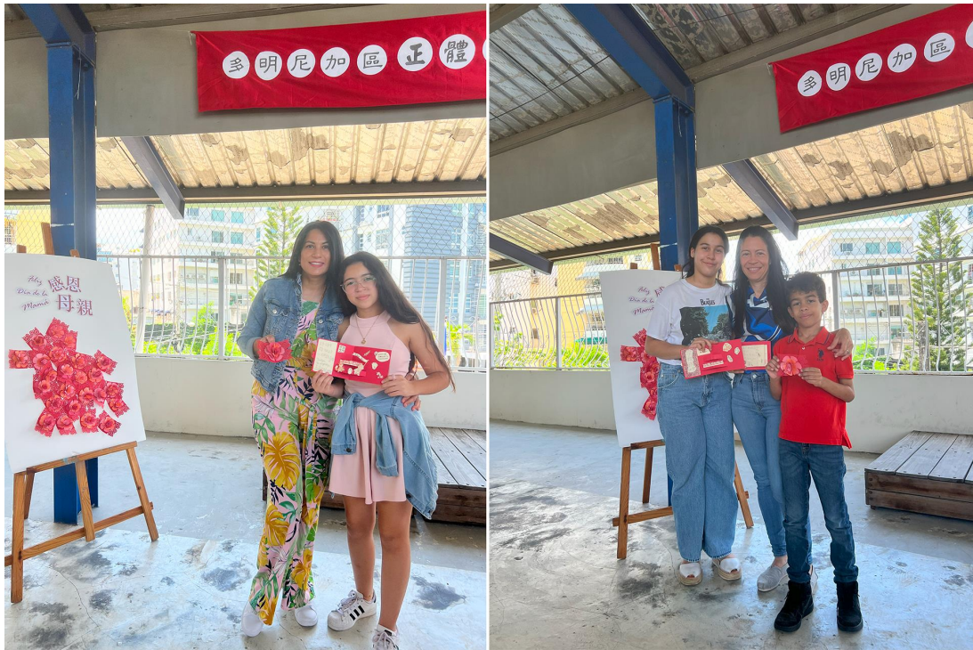
多明尼加臺灣商會附屬中文學校2024母親節活動 - Feliz día de la Mamá 感恩母親5