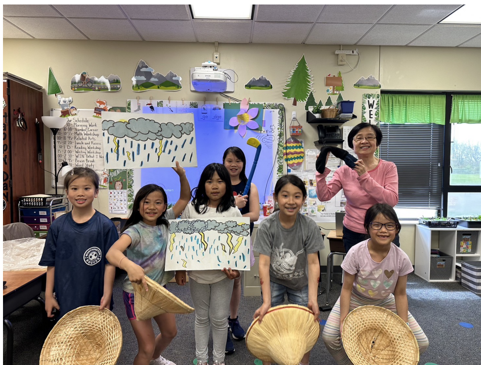
俄亥俄州哥城中文學校 2024年華語教唱活動1

可以看得出來，老師對歌曲的選擇很用心，除了一些我們耳熟能詳的歌曲，也嚐試一些比較近期的年輕歌曲，或是添加了新的元素，像是戲劇和古詩，讓學生對華語歌更有親切感和好奇心。學校更安排在謝師宴等的全校性活動中表演，讓學生們的學習成果可以和家人朋友們一起分享。