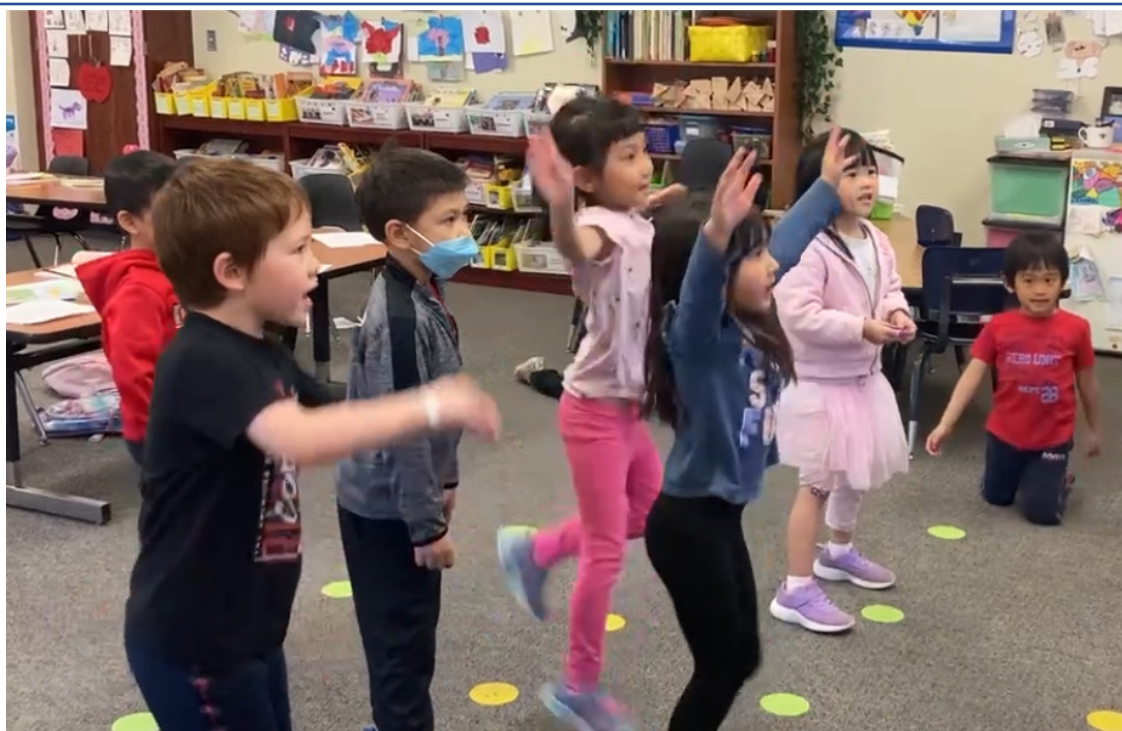
俄亥俄州哥城中文學校 2024年華語教唱活動5