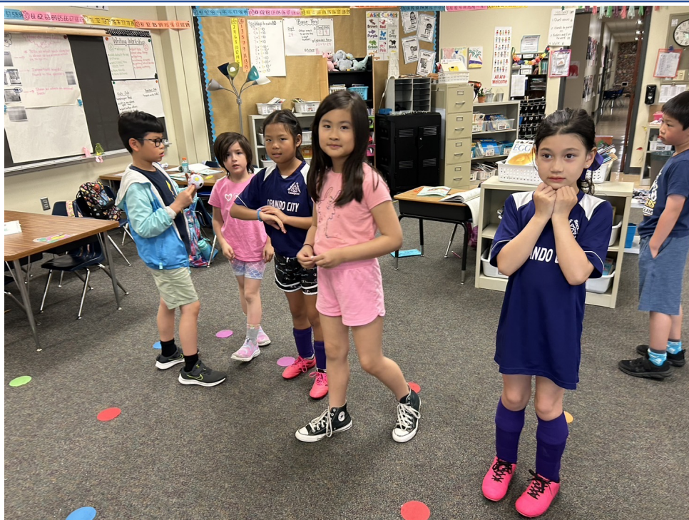
俄亥俄州哥城中文學校 2024年華語教唱活動4