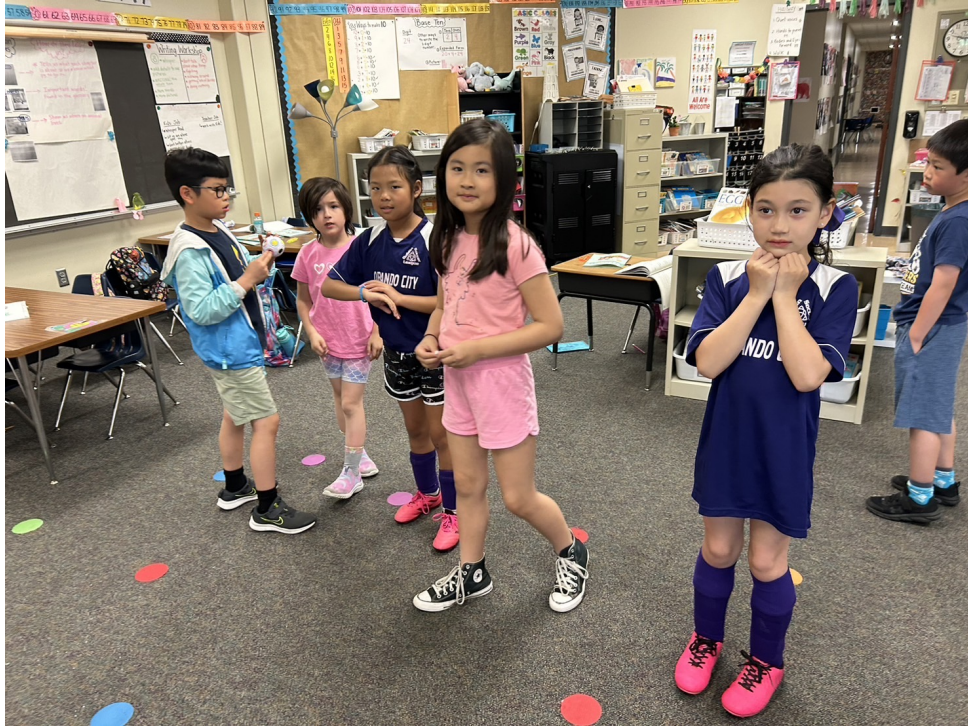
俄亥俄州哥城中文學校 2024年華語教唱活動4