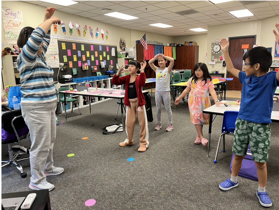
俄亥俄州哥城中文學校 2024年華語教唱活動6