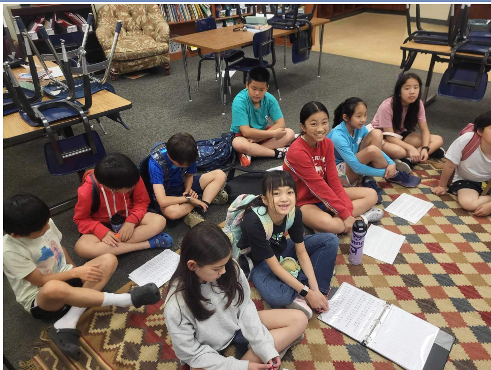
俄亥俄州哥城中文學校 2024年華語教唱活動3