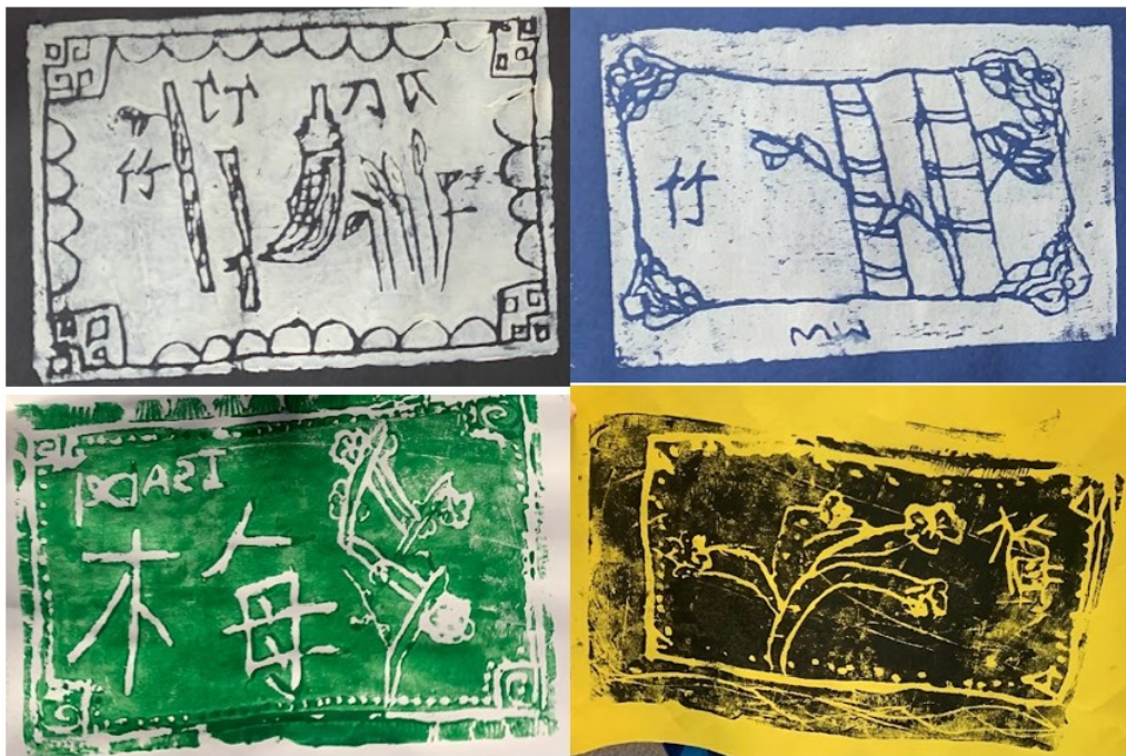
文字意境版畫創作

學生們對這個課程反應非常熱烈，從創作草稿、製版、上色到最終印製的整個過程，都讓他們感受到了自己設計躍然紙上的成就感，深入體驗了台灣傳統文化的魅力。