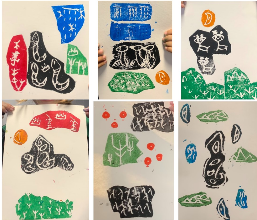
象形文字的回版印製