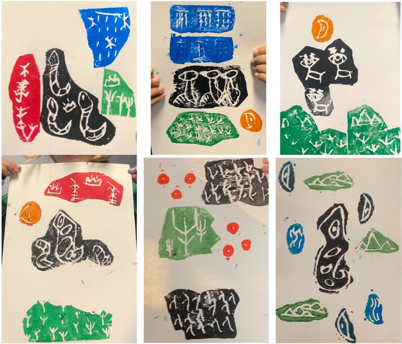
象形文字的凹版印製