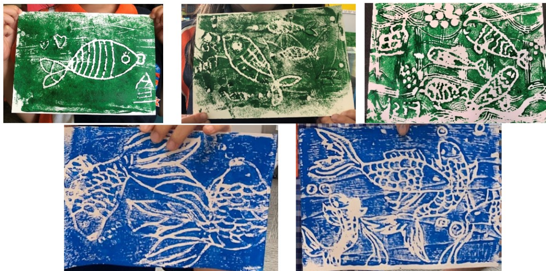
單一顏色拓印作品