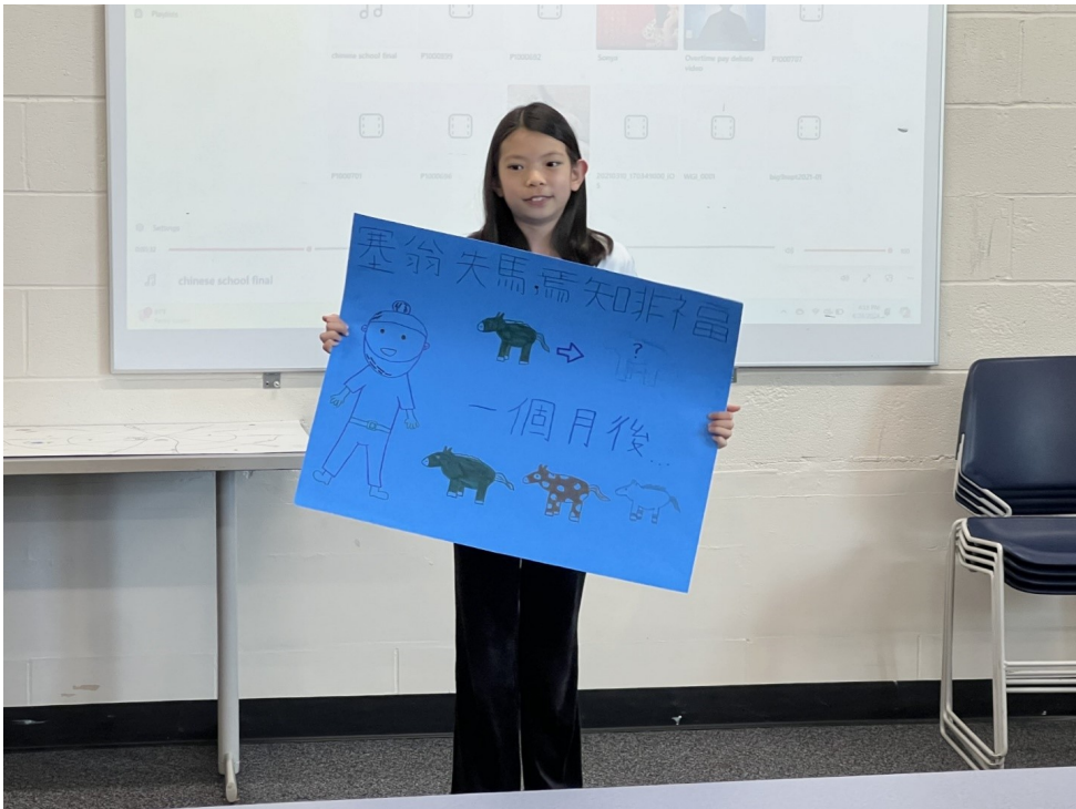
參賽學生創作海報解釋成語典故