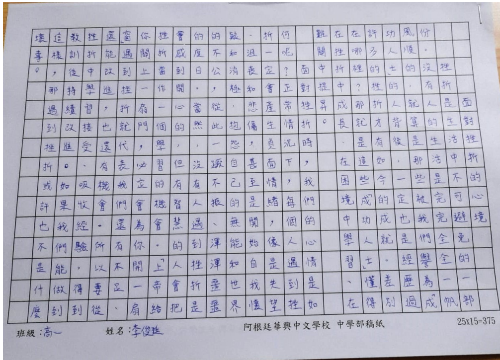
阿根廷華興中文學校2024中學部作文比賽2