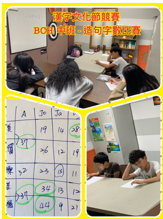
喜樂中文學校 2024第一季正體字識讀競賽2