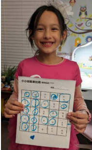
僑委會漢字文化節競賽