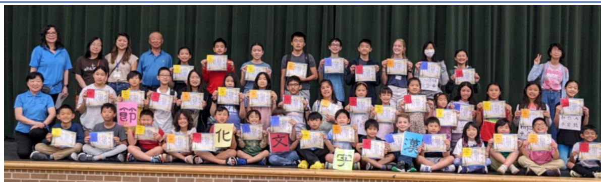
漢字文化節書法與造詞比賽得獎學生