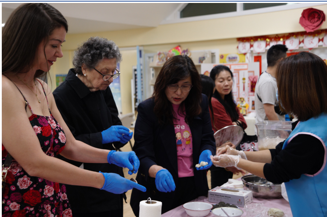
文化體驗區-現場DIY包麻糬教學