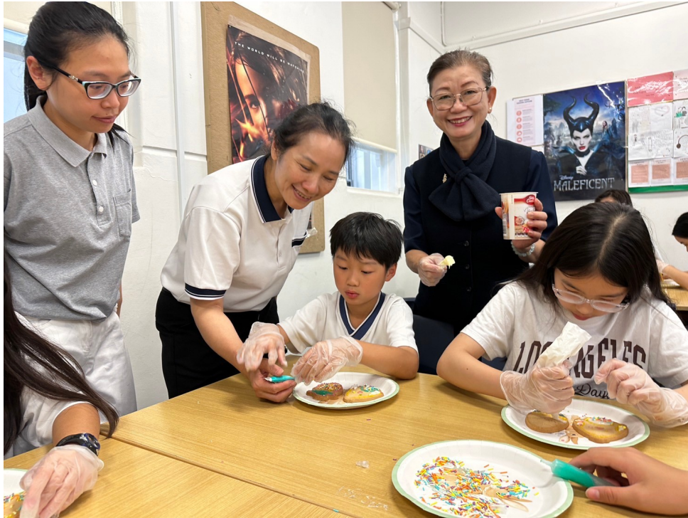
澳洲慈濟人文學校舉辦2024漢字文化節 說故事活動6