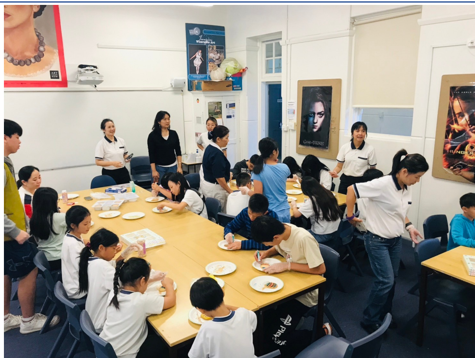
澳洲慈濟人文學校舉辦2024漢字文化節 說故事活動4