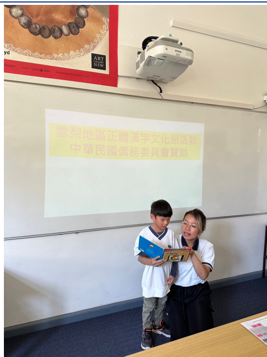
澳洲慈濟人文學校舉辦2024漢字文化節 說故事活動2