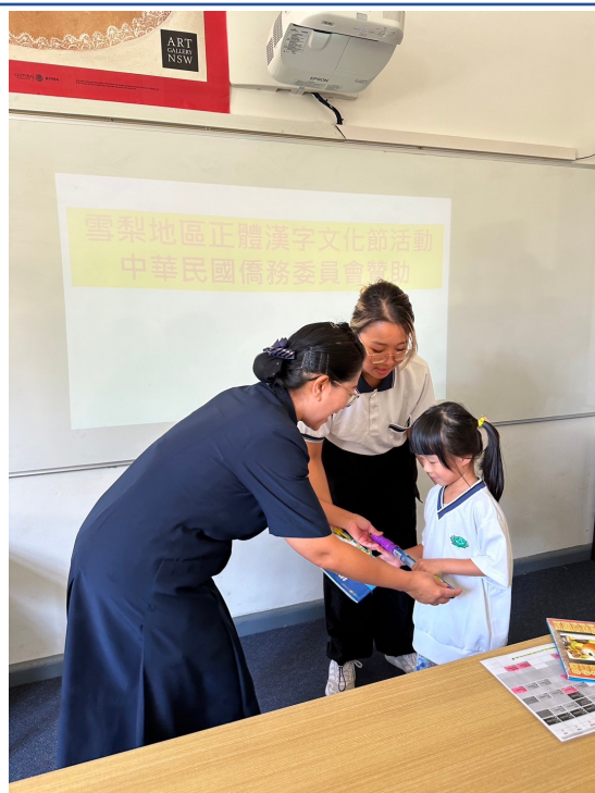
澳洲慈濟人文學校舉辦2024漢字文化節 說故事活動3