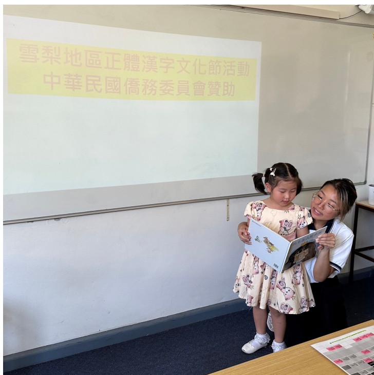
澳洲慈濟人文學校舉辦2024漢字文化節 說故事活動1

3月31日剛好是2024年復活節週末，老師也介紹復活節的由來，及復活節的各種活動。東西文化教學結合，學校也安排班級聯合活動，孩子很興奮能夠有機會裝飾自己的復活節餅乾，比賽創意。