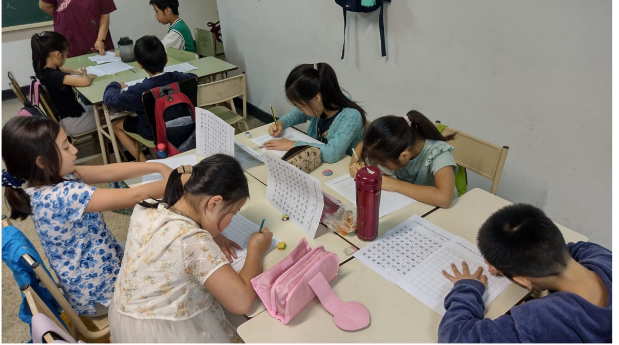
阿根廷華興中文學校2024年 小學部硬筆字比賽6