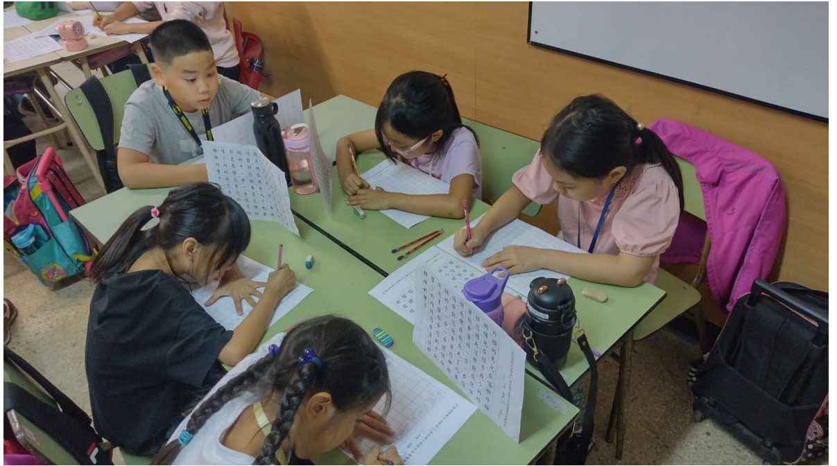
阿根廷華興中文學校2024年 小學部硬筆字比賽5