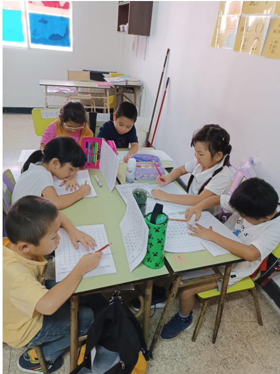
阿根廷華興中文學校2024年 小學部硬筆字比賽3