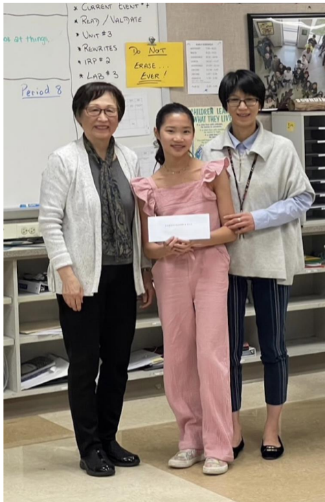
2024明德中文演講比賽4