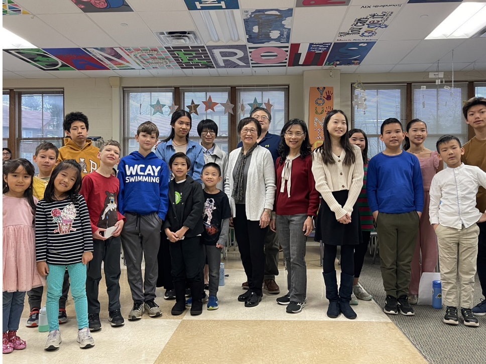
2024明德中文演講比賽6