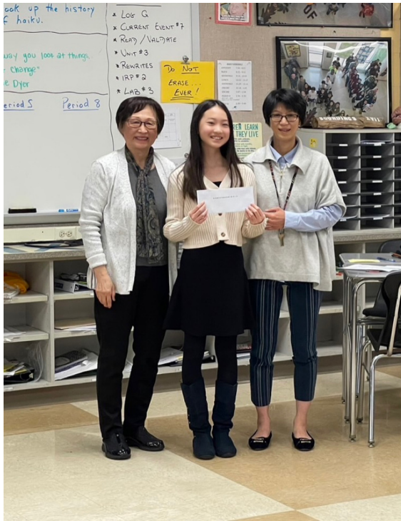
2024明德中文演講比賽5