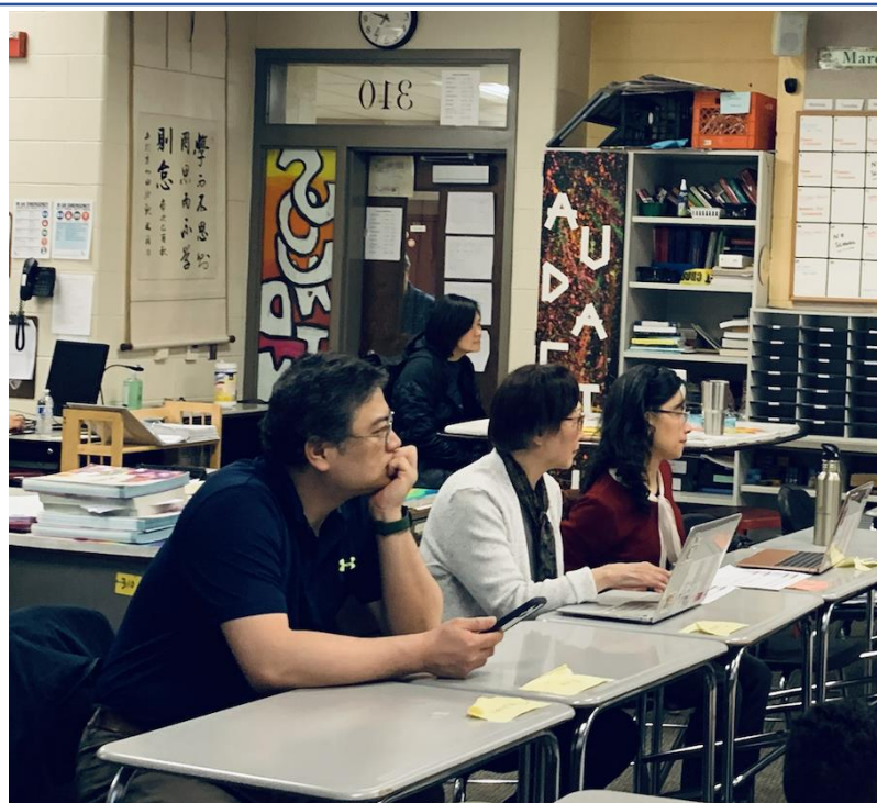
2024明德中文演講比賽3