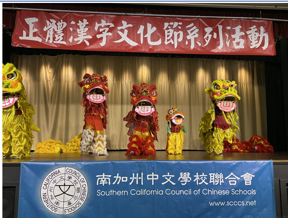
Ce中文學校以祥獅獻瑞揭開2024漢字文化節漢字文化節