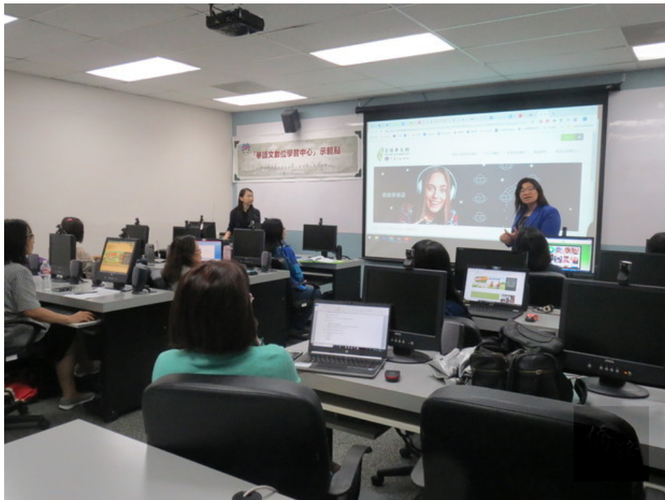
休士頓示範點數位教學培訓 推廣全球華文網1

休士頓文教中心數位華語文教學示範點本年度將陸續開設6堂精彩課程，增進僑校以及主流學校老師教學能力，以最新數位教學在海外推展華語文。