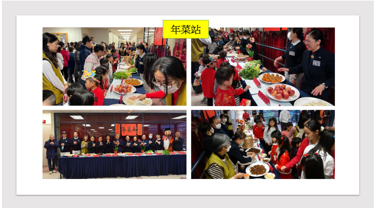
年菜站展示各式各樣的年菜及對應的吉祥話