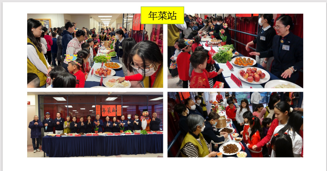
年菜站展示各式各樣的年菜及對應的吉祥話