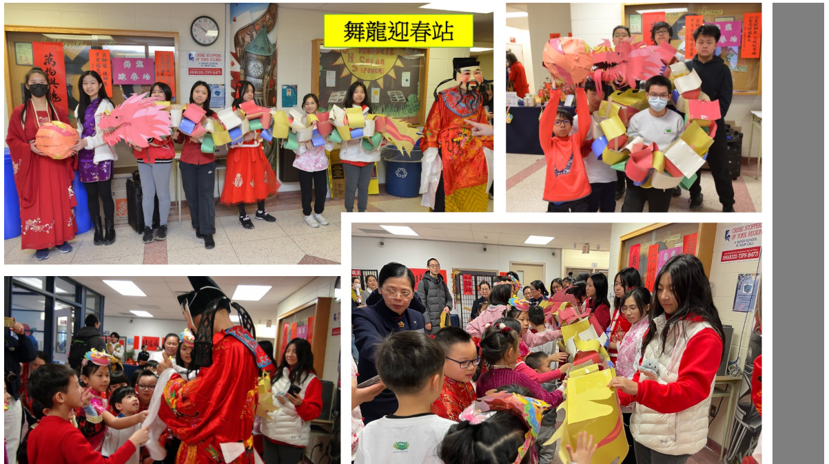
舞龍迎春及財神爺