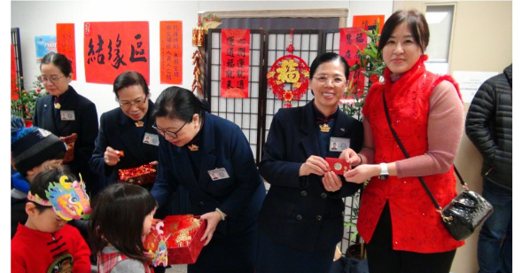
派發龍年紅包和結緣品及竹筒歲月站