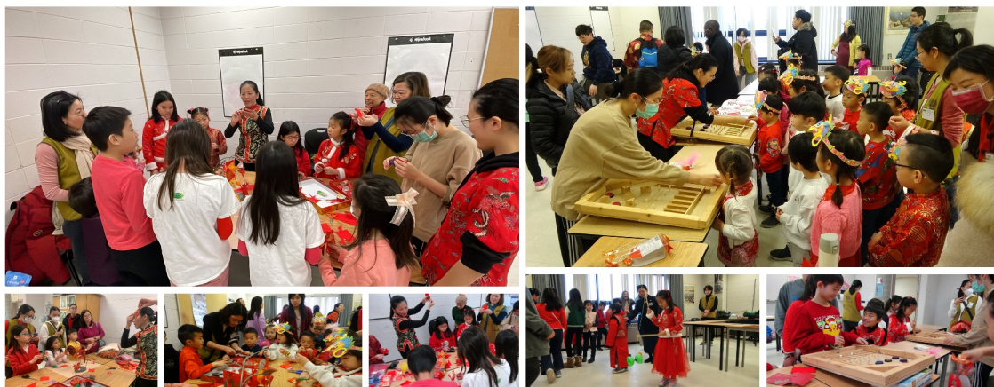
十二生肖配對樂、童玩及紅包魚剪紙