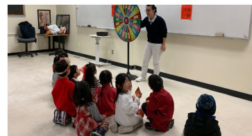
龍騰齊歡賀新春站