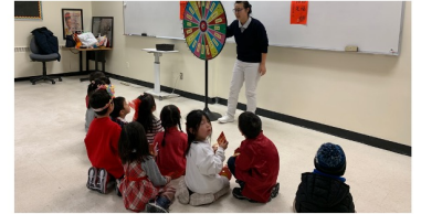
龍騰齊歡賀新春站