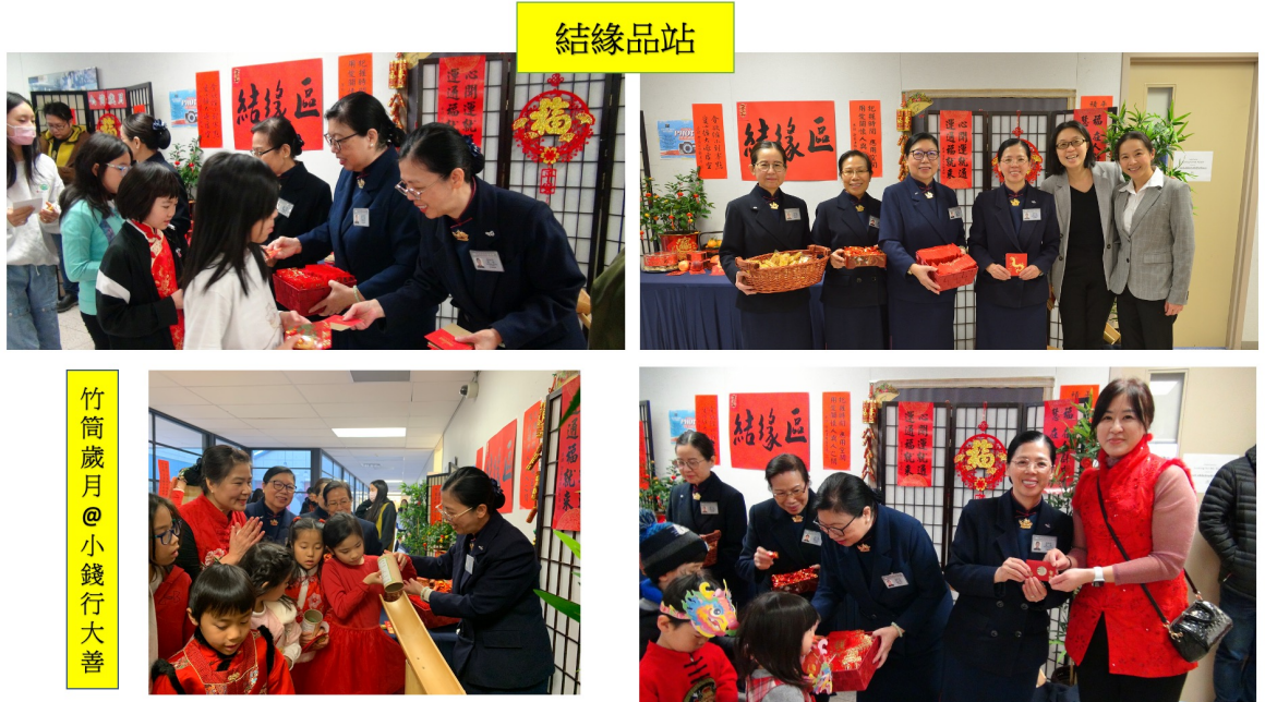
派發龍年紅包和結緣品及竹筒歲月站