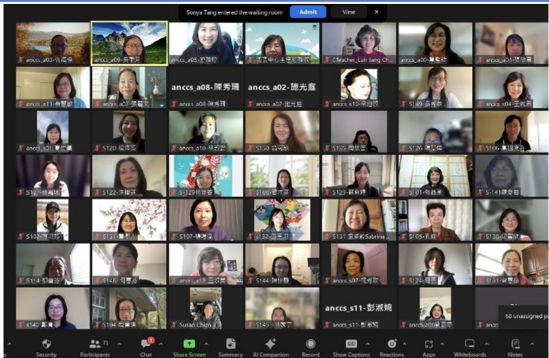
2023北加州中文學校聯合會教學研討會1