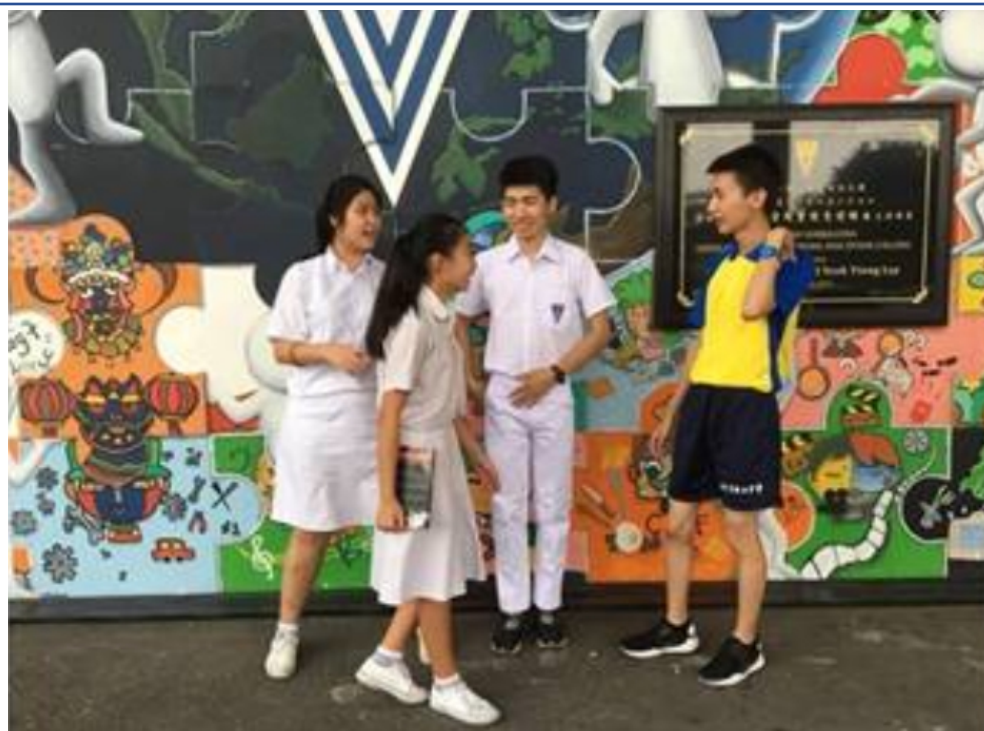
「暨」情大馬，共築「悅」讀桃花源 — 國立暨南國際大學1