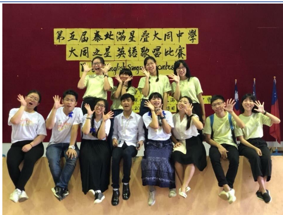
要回去了，回到真正的世界裡—元智大學國際志工泰北團2