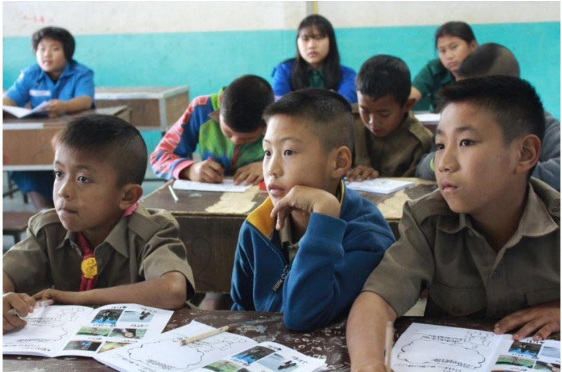
2018寒假 看見北方泰陽 - 政大國際志工社 泰北服務隊6