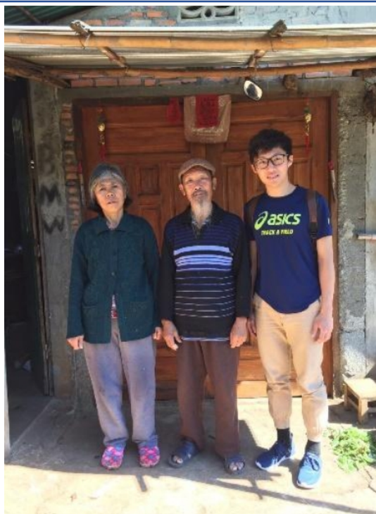
2018寒假 看見北方泰陽 - 政大國際志工社 泰北服務隊4