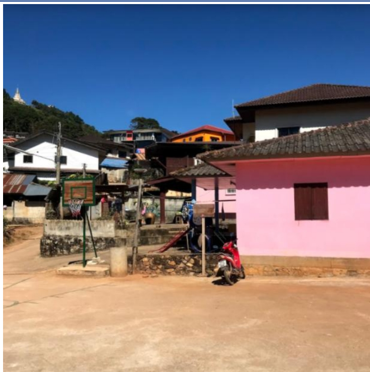
2018寒假 看見北方泰陽 - 政大國際志工社 泰北服務隊5