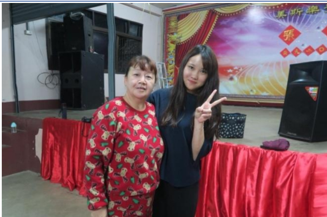
2018寒假 看見北方泰陽 - 政大國際志工社 泰北服務隊3