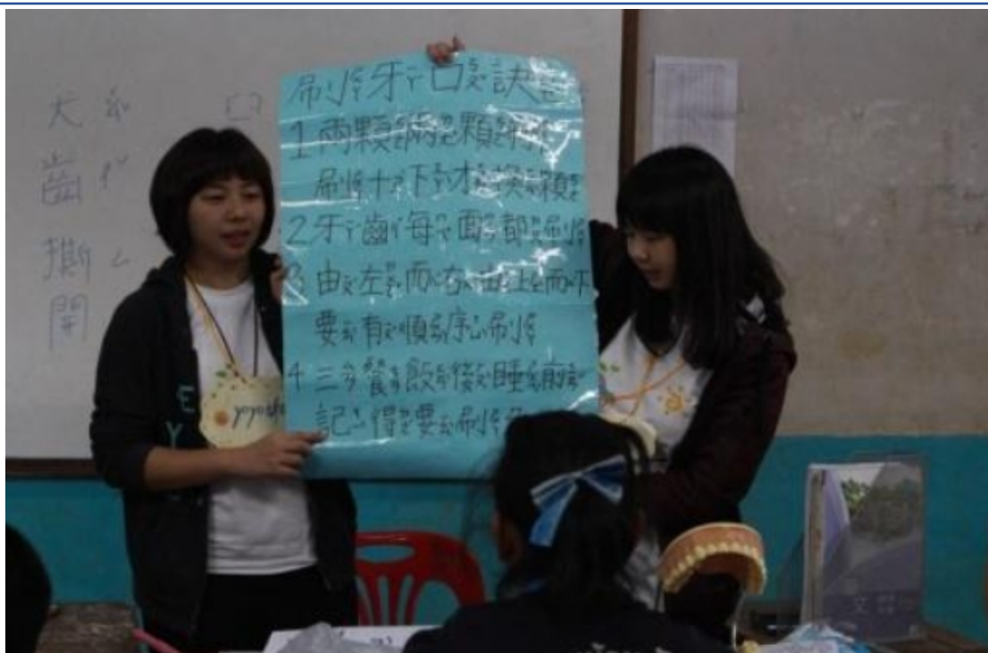
2018寒假 看見北方泰陽 - 政大國際志工社 泰北服務隊2