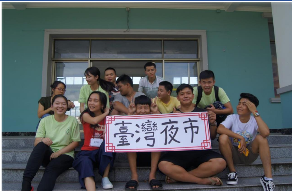
2019手牽手心甸心 II—國立臺北商業大學國際志工緬甸隊3