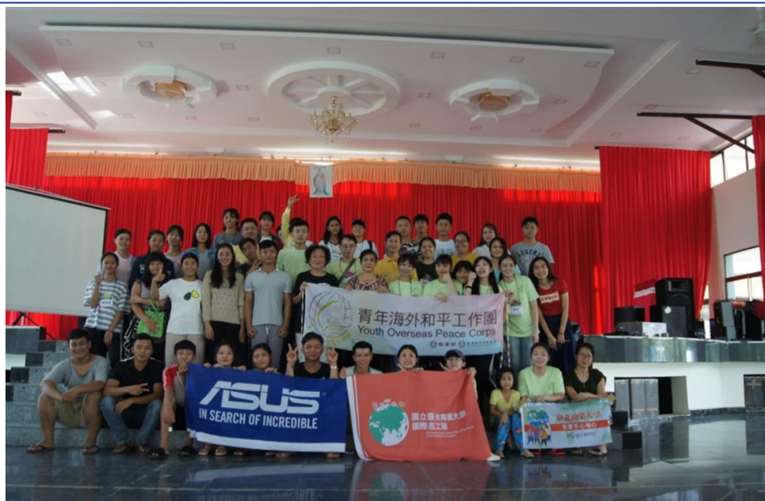
2019手牽手心甸心 II－國立臺北商業大學國際志工緬甸隊1