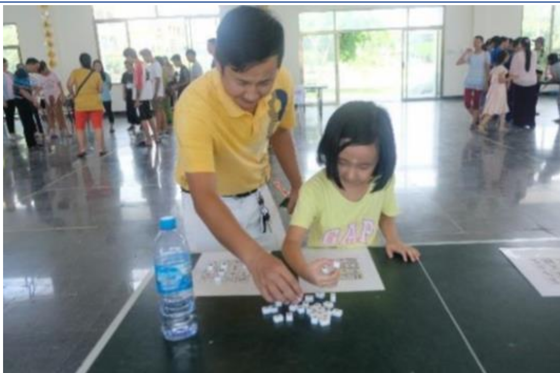
2019手牽手心甸心 II－國立臺北商業大學國際志工緬甸隊4