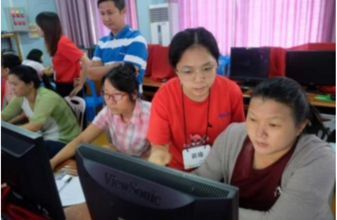
2019手牽手心甸心 II—國立臺北商業大學國際志工緬甸隊5