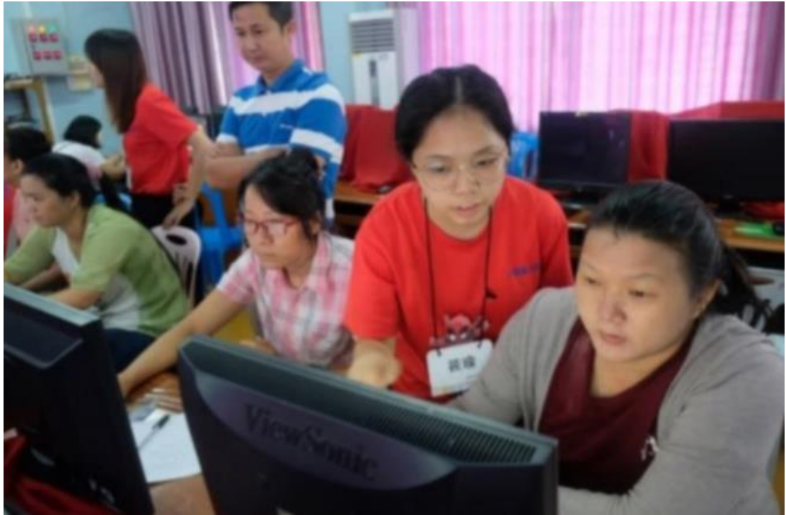
2019手牽手心甸心 II－國立臺北商業大學國際志工緬甸隊5