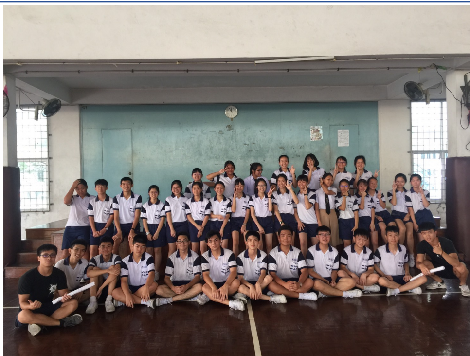
明德惟馨●公教更新-明新科技大學1