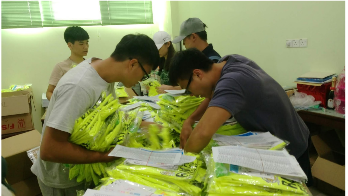
明德惟馨●公教更新-明新科技大學3