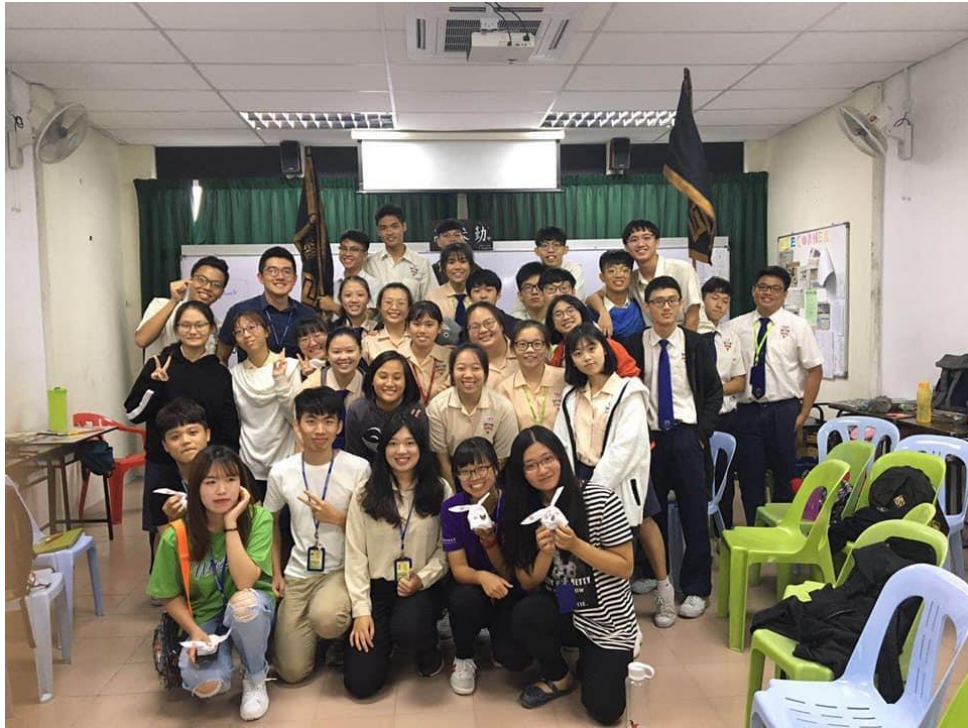
2019【芙蓉出水，出入相隨】：馬來西亞芙蓉中華中學多元文化交流與教學支援服務-國立屏東大學課外活動指導組國際志工隊2