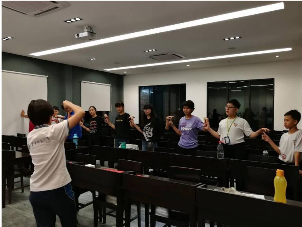
2019【芙蓉出水，出入相隨】：馬來西亞芙蓉中華中學多元文化交流與教學支援服務-國立屏東大學課外活動指導組 國際志工隊1