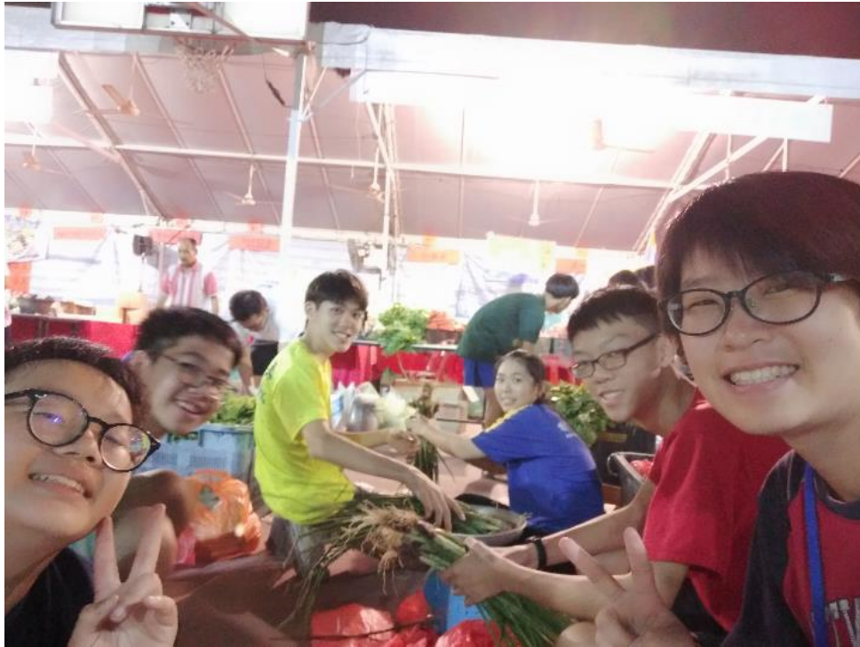
2019【芙蓉出水，出入相隨】：馬來西亞芙蓉中華中學多元文化交流與教學支援服務-國立屏東大學課外活動指導組 國際志工隊3