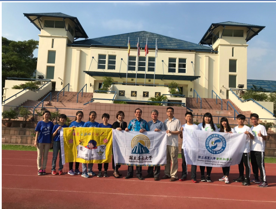
飛越國界—「資」「資」不倦—屏東大學資訊服務社2