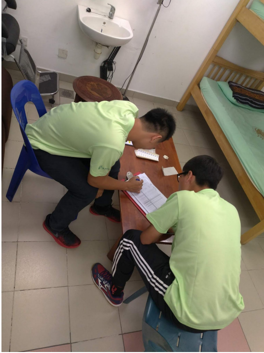
飛越國界—「資」「資」不倦—屏東大學資訊服務社4