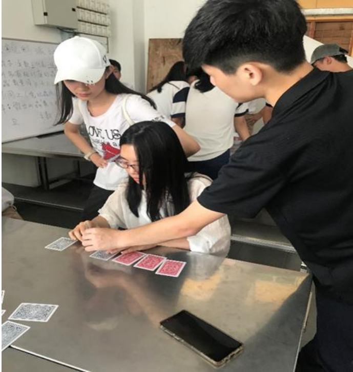
2019年大馬去起來輔導團 輔仁大學數學系4