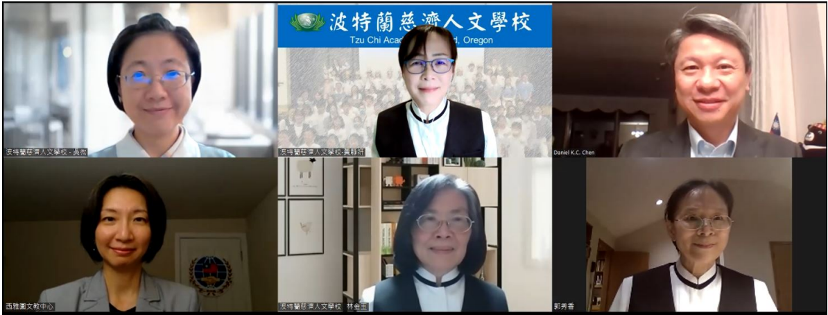
教師獎勵得獎老師合照