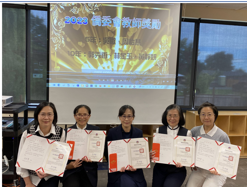
頒發五位教師年資獎勵 獎狀、獎金