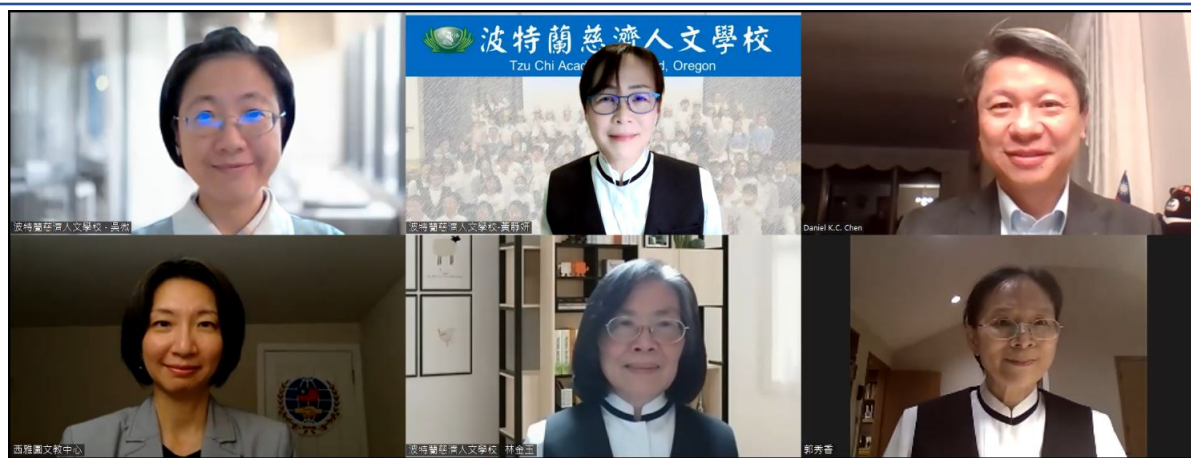
教師獎勵得獎老師合照