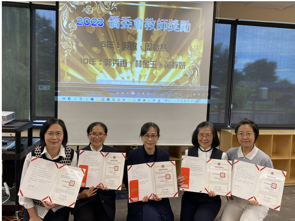
頒發五位教師年資獎勵 獎狀、獎金