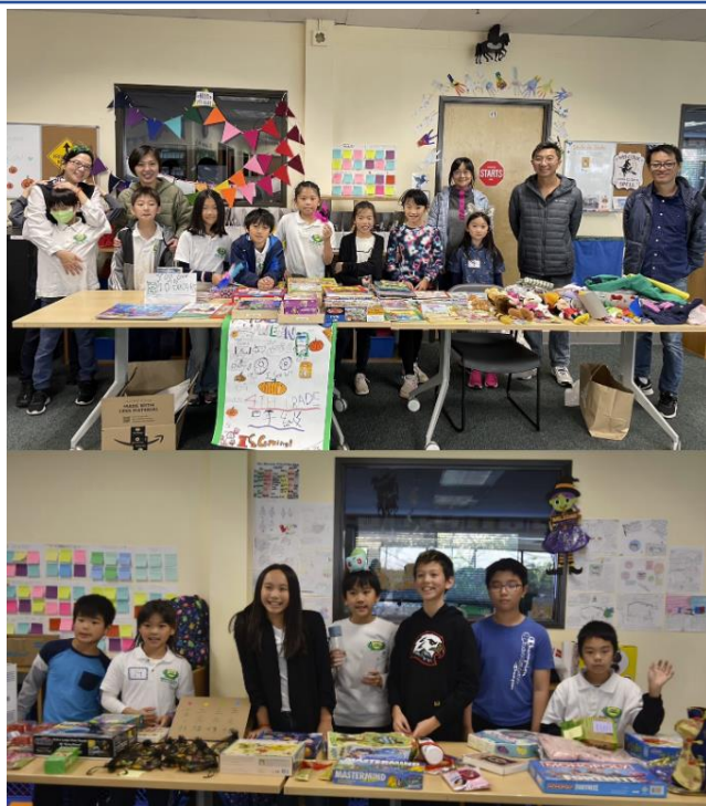
上圖：四冊班學生與家長志工，下圖：五冊班學生。