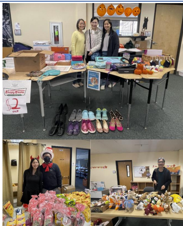
家長與志工們協助攤位。