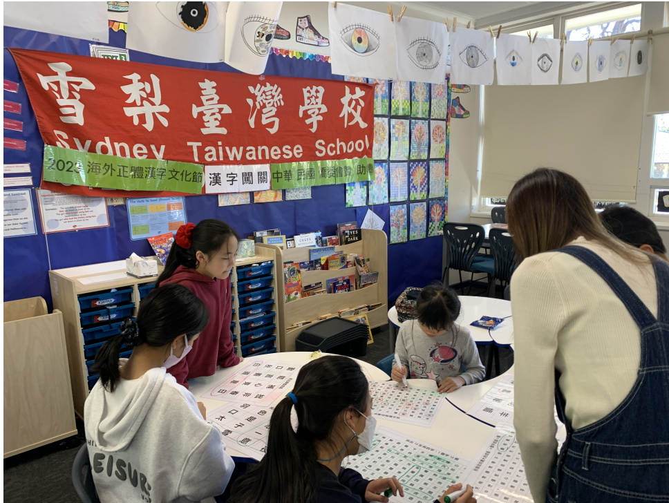
學生尋找成語挑戰