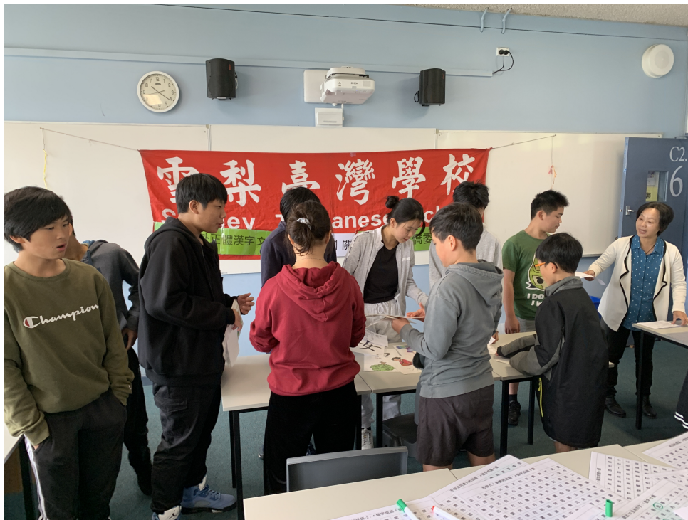
現場學生熱情參與

雪梨臺灣學校的正體漢字文化節是一個多彩多姿的活動，旨在傳遞正體漢字的內涵與藝術，並為學生提供一個豐富的文化體驗傳遞文化價值。校方表示今年共舉辦了8場正體漢字文化節活動，深獲家長的肯定與學生的喜愛。正體漢字文化節活動不僅激發了參與者對漢字文化的興趣，還提供了一個有趣的方式來學習和深入了解中華文化，讓在雪梨臺灣學校學習中文的海外僑校學生除學習中文外，更享受一個豐富多彩的文化體驗。雪梨臺灣學校在雪梨地區推廣中文教育長達32年，不僅積極推廣中文教育，還熱衷於傳承和弘揚中華文化，今年8場的正體漢字文化節活動不僅是對中文教育的持續努力不懈外，更是對中華文化積極推廣和傳承的體現。