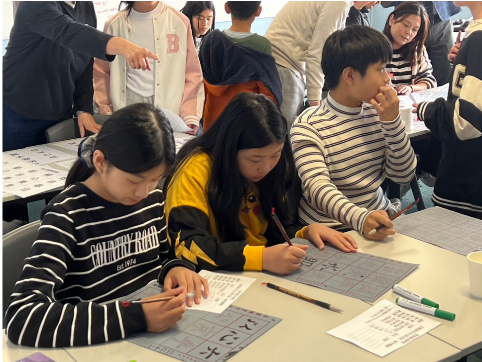
學生毛筆漢字書寫闖關