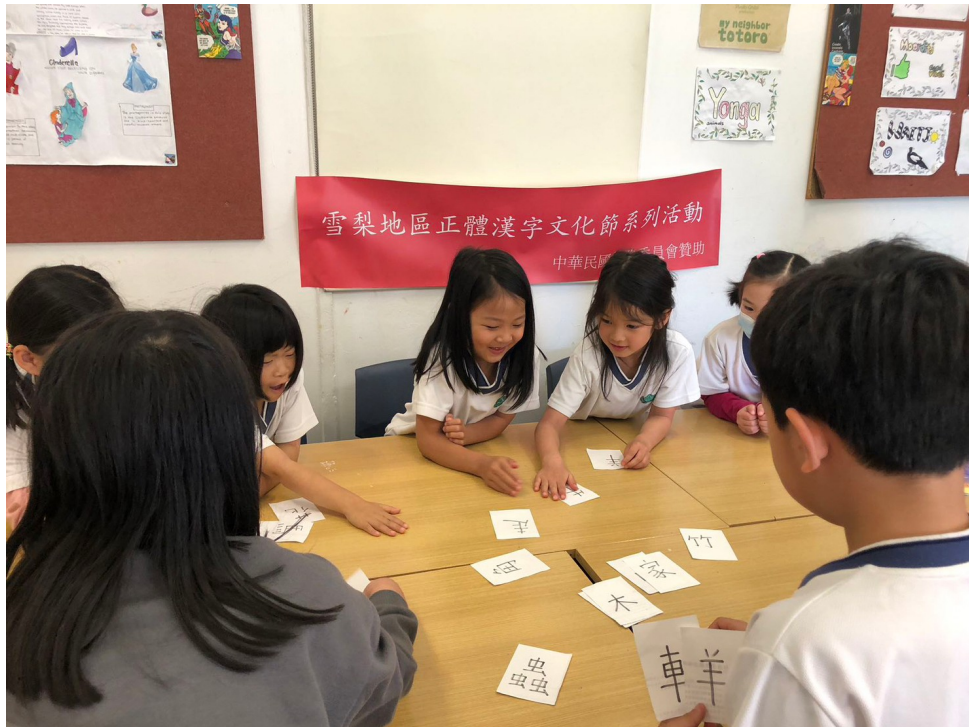
幼稚園組漢字闖關遊戲