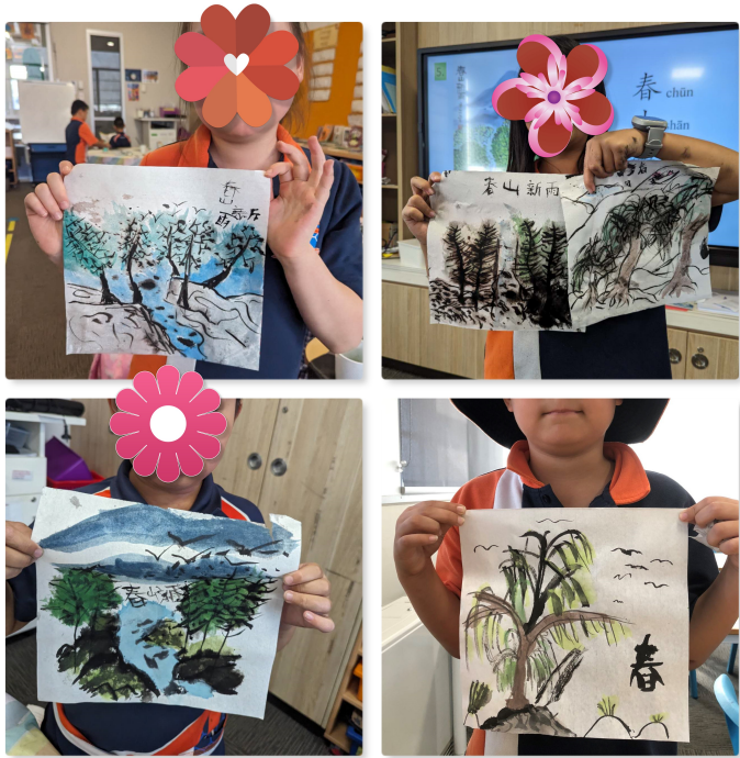
雪梨西北中文學校2023第四學期藝術創想課程2