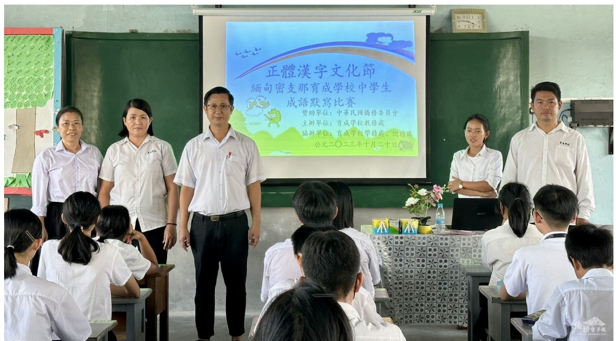
育成學校舉辦2023年度正體漢字文化節成語默寫比賽