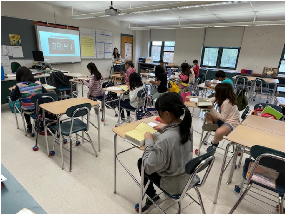
四年乙班學生聚精會神地作答