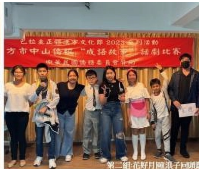
第二組:花好月圓浪子回頭