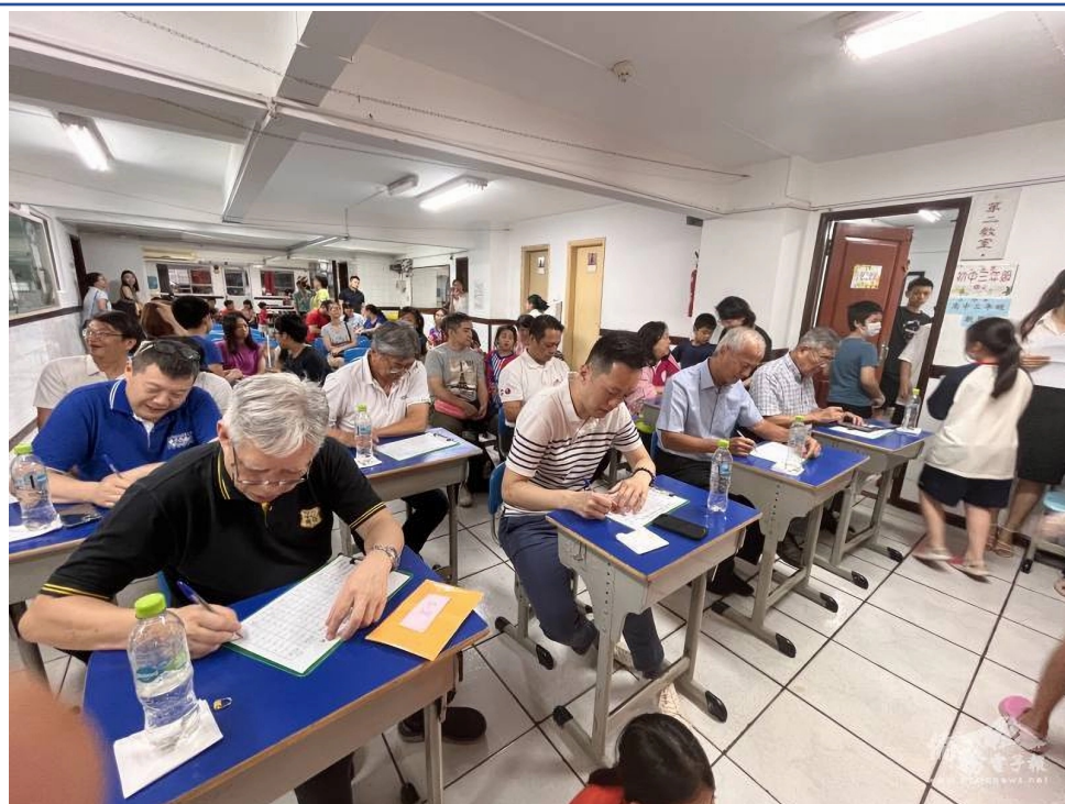
評審團認真審評每組表演