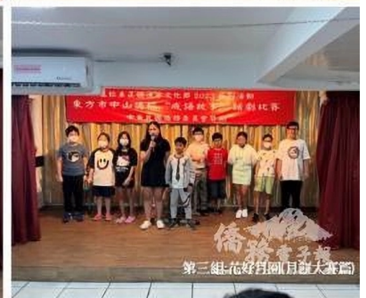
第六組:花好月圓浪子回頭