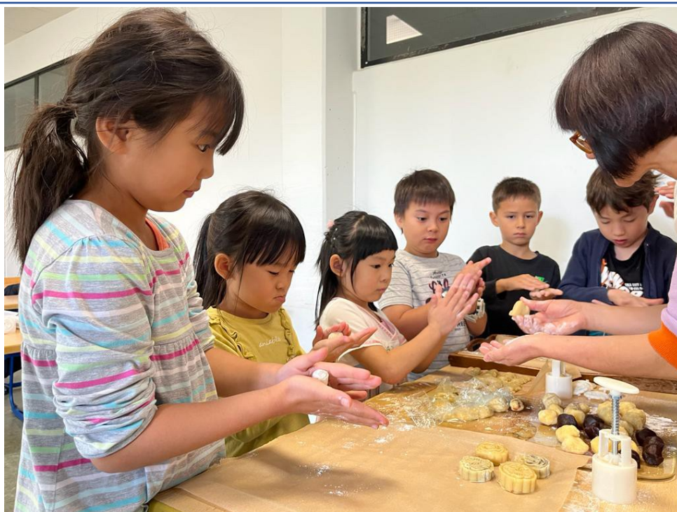
包月餅活動-糕點老師細心教導學員如何製作月餅