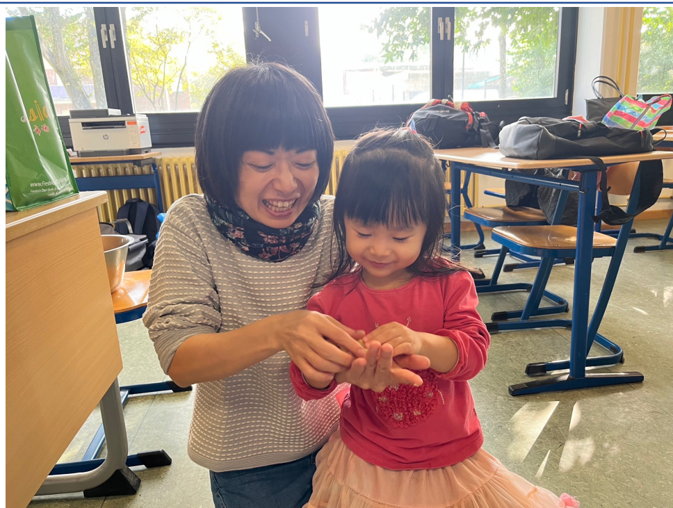
包月餅活動-學員與家長一起包月餅，超級開心!