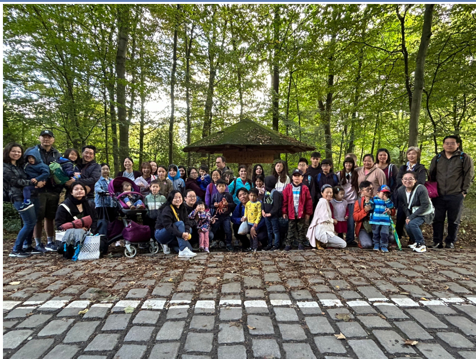
秋遊-在森林公園開心合照