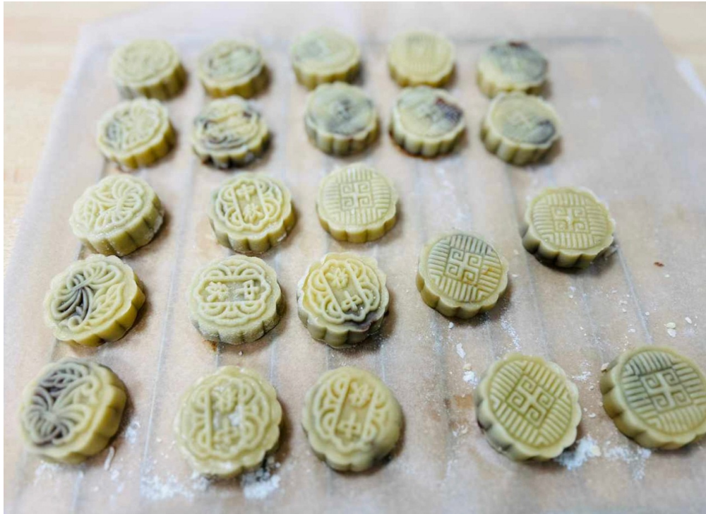
包月餅活動-做好的月餅，等著要進烤箱就可以完成了！