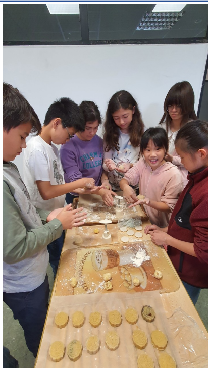
包月餅活動-全班一起做月餅好開心!