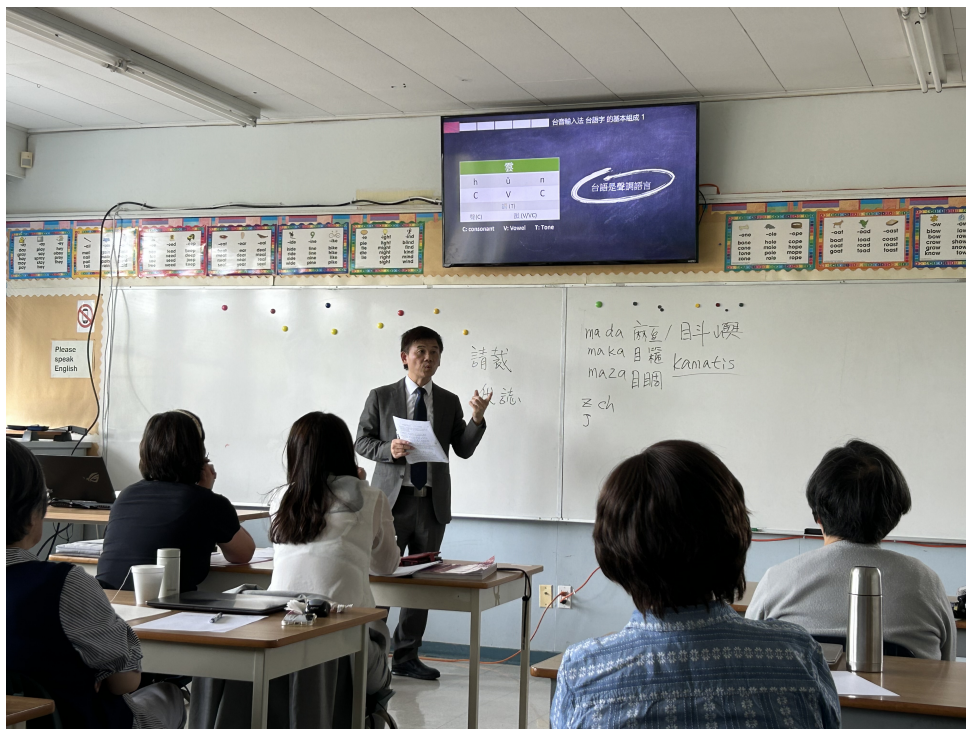
學員專注聆聽胡志明博士介紹臺音7.0輸入法

期待與祝福江永進教授研究多年發展出來的通用台音7.0輸入法能進一步被廣泛使用，成為海外母語教學最大助力！