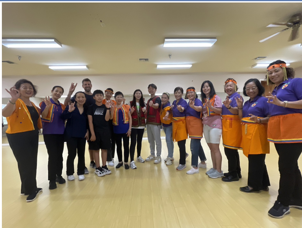
舞蹈課結束後大合照