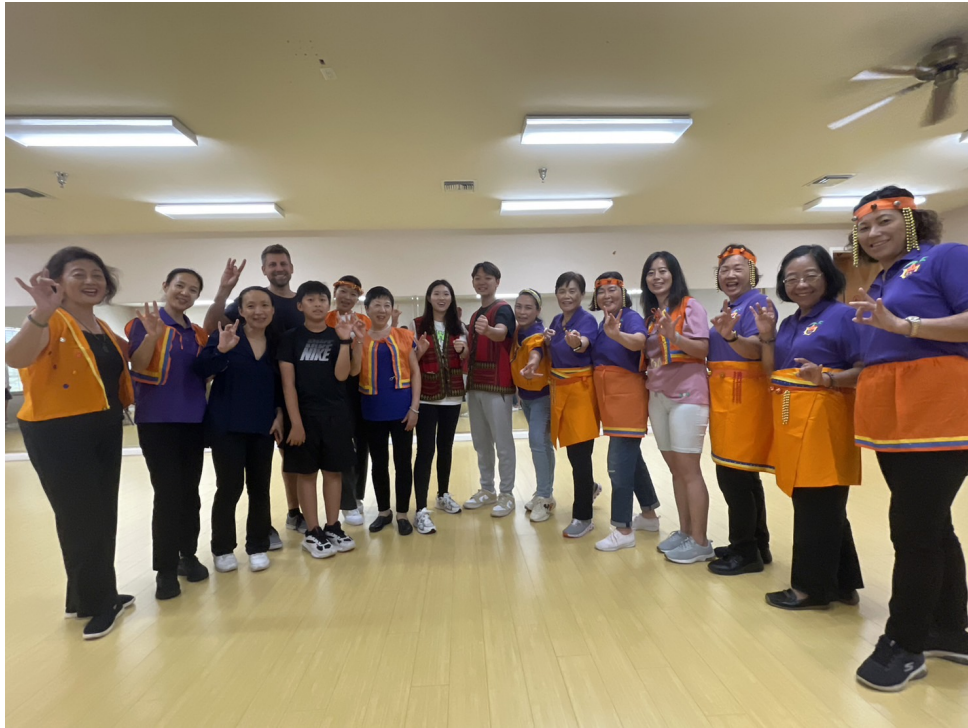
舞蹈課結束後大合照