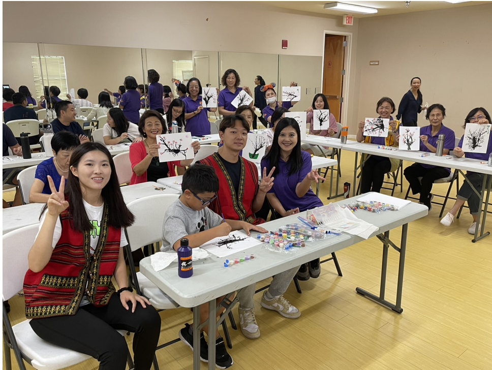
吹墨畫作品完成後大合照