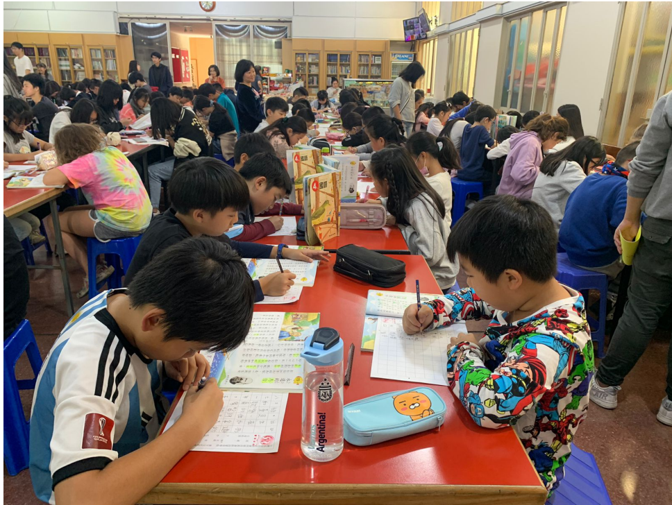
112學年度愛育學校正體漢字文化節「全校寫字比賽」1