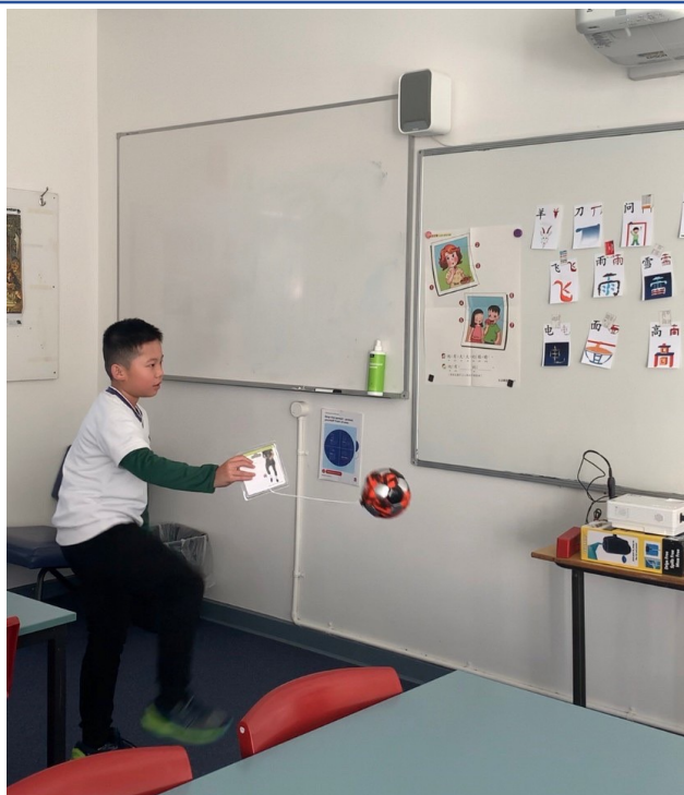
漢字辨識結合踢球活動